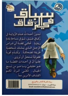
(الصورة ٢- الغلاف الخلفي)

إعياً، ويبدو على الغلاف الخلفي جزء من كلمة المقدمة تبين ما تحكي عنه الرواية؟ وأين تدور أحداثها؟ وطبيعة تلك الأحداث بشكل موجز مأخوذ من المقدمة، إضافة إلى أيقونة دار النشر، وهما في الغلاف أيقونتان إشهاريّتان توضّحان المصدر، والدار التي طبعت الرواية، وبياناتها التواصلية، وبهذا تكون صورة الغلاف -كما يراها كتاب أدب الطفل- "منطقة جذب نفسي ووجداني للطفل للدخول إلى عالم الكتاب، وغلاف الكتاب يقود الطفل إلى داخله أو ينفره منه" (١) .