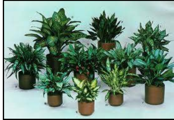
شكل ( 9 ) يوضح النبات الطارد للحشرات

البيئه المحيطه لها ويدعي هذا النبات " Aglaonema dieffenbachia " شكل ( 9 ) وقد استفاد مبتكري اجهزة طرد الناموس وخاصة في المناطق الزراعيه التي يكثر فيها انتشار الناموس في فصل الصيف من صنع اقراص تحمل مواد كيميويه عند وضع القرص في الجهاز يتعرض للحراره التي تعمل علي انتشار هذه الماده الكميويه التي تعمل علي طرد الحشرات من محيط يتراوح تقريبا ما بين 4/1 الي 5/1 كيلو متر شكل ( 10 ) .