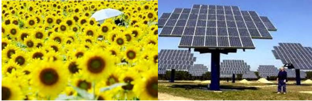
الشكل ( 5 ) يوضح نبات عباد الشمس متجه الي شعاع الشمس ومستقبلات الشعاع الشمسي وهي متجه الي شعاع الشمس طوال ساعات النهار

ومن الاستفادة من خصائص نبات عباد الشمس الذي يتوجه دائما