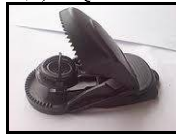
شكل ( 2 ) يوضح الاستفادة من نبات " النيبينش " في تصميم مصيده للفئران

جاء في مقال في جريدة الحياة اللندنية للكاتب ( أحمد مغربي ) تعرف التقنية النانوية بأنها تطبيق علمي يتولى إنتاج الأشياء عبر تجميعها على المستوي الصغير من مكوناتها الأساسية ، مثل الذرة والجزيئات. وما دامت كل المواد المكونة من ذرات مرتصفة وفق تركيب معين، فإننا نستطيع أن نستبدل ذرة عنصر ونرصف بدلها ذرة لعنصر آخر، وهكذا نستطيع صنع شيء جديد ومن أي شيء تقريبا. وأحيانا تقاچننا تلك المواد بخصائص جديدة لم نكن نعرفها من قبل، مما يفتح مجالات جديدة لاستخدامها وتسخيرها لفائدة الإنسان، كما حدث قبل ذلك باكتشاف الترانزستور. وتكمن صعوبة التقنية النانوية في مدى إمكانية السيطرة على