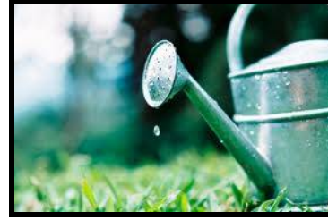
شكل ( 14 ) يوضح دلو الري