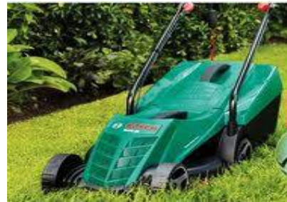
شكل ( 15 ) ماكينة قص الحشائش

وتوجد بعض النباتات الهامه ذات اللون الاخضر التي يستخدمها الانسان في الحفاظ علي البيئه الخضراء تدعي " النجيله " وهذه النوعيه من النباتات تحتاج كل قتره زمنييه الي عمليه القص للحفاظ علي مظهرها ، فبدلا من ان كان الانسان يستخدم منجل قص الحشائش الذي كان يكلفه مجهودا فسلوجيا عنيقا ، فقد اخترع المصممون ماكينه لقص الحشائش كما بالشكل ( 22 )