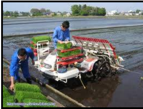
شكل ( 12 ) يوضح ماكينه غرس شتلات الارز

عملية الغرس : يوضح شكل ( 12 ) ماكينه مصممه لغرس الشتلات الارز ، وطبقا لخصائص هذه الشتلات يتم جمعها ووضعها في المكينه وتقوم هذه المكينه بغرسه بطريقه منظمه في الارض المرويّه بالماء كما هو واضح بالشكل .