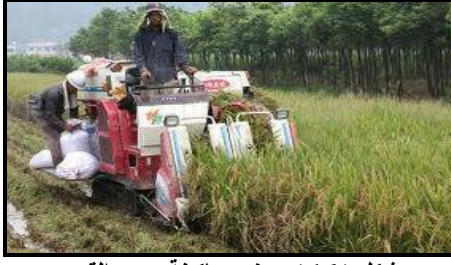
شكل ( 16 ) يوضح ماكينة حصد القمح