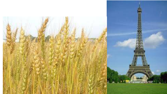
شكل ( 16 ) يوضح الحركة المرنة لاغصان النبات وكيفية الاستفادة منها في الإنشاءات

شكل ( 10 ) يوضح الجهاز الذي توضع به اقراص الناموس وقد تعلمنا من النبات الكثير وخاصة في بنيته الانشائيه ، فمثلا مرونة النبات هي التي تجعله مقاوما للرياح ، حيث صلابه الاشجار في بعض المناطق لا تصمد في وجه الرياح والعواصف القويه اما النباتات ذو المرونه الحركيه والتي تتحرك مع الرياح تجعلها صامده في وجه اعنف العواصف وهذا ما قام به المهندس الفرنسي ايفيل في تصميمه لبرجه الشهير في العاصمه باريس ، فقد جعل راس البرج حره الحركة لـ 12.5 سنتيمتر في كل الاتجاهات حيث يتم اخلاء البرج في وجود العواصف الشديده من الزوار وتتجاوب حركة الراس مع اتجاه الرياح للمقاومه حتي لا تقتلع الراس من موضعها شكل ( 16 ) .