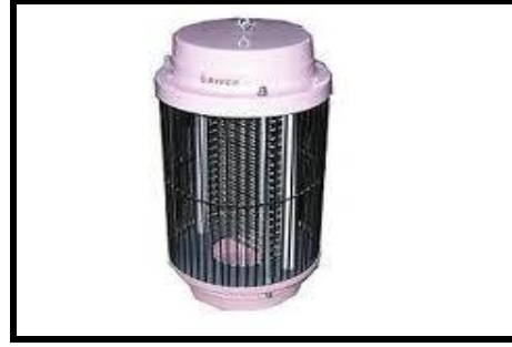
شكل ( 4 ) يوضح صاعق الناموس

وقد تمت الاستفادة من اسلوب التغذية في النباتات باستخدام خاصيه تعرف باسم الخاصيه الشعريه والتي يقوم بها النبات برفع المياه الي الاغصان واوراق النباتات العلويه ، وقد وظف الانسان هذه الخاصيه في ابتكار مشعل يعرف باسم بابلور الفتائل حيث تستخدم الفتائل القطنيه في رفع الجاز ( سولار ) من الخزان اسفل المشعل الي اعلي ليظل مشتعلا باستمرار وقت الحاجه شكل (6).