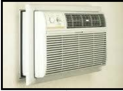
شكل ( 11 ) يوضح التكييف الذي يحول ثاني اكسيد الكربون الي اكسجين

الي تحويل اجهزة التكييف الي اجهزه تنقي الهواء بدلا من انها تقوم بعملية التبريد فقط شكل ( 11 ) .