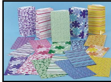
شكل ( 7 ) يوضح الاشكال الزخرفيه المستوحاه من النباتات ومستخدمه في الاقمشه المختلفه

وبالرغم من وجود نباتات وزهور بطبيعتها تجذب الحشرات اليها للغذاء او الحصول علي الماوي لها ، فتوجد ايضا نباتات بطبيعتها تفرز مواد صمغيه ذو رائحه تعمل علي عدم تجمع الحشرات في