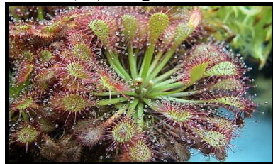
شكل ( 3 ) يوضح الاعصاب الصمغيه الجاذبه للحشرات في نبات ورد الشمس

ومن الخصائص الاخرى التي تم الاستفاده منها هي تصميم صاعق الناموس والذي يستند الي خصائص نبات ورد الشمس والذي يحتوي علي مواد صمغيه جاذبه للحشرات شكل ( 3 ) ، حيث عندما تقترب الحشرات منه تلتصق بها وتتحلل ويتغذي عليها النبات . وهذا ما يتم بصاعق الناموس حيث يتم استخدام الضوء كجاذب للحشرات بدلا من الصمغ شكل ( 4 ) .