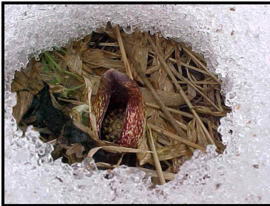
شكل ( 8 ) يوضح النبات المولد للحراره يدعي " skunk cabbages "

وقد استوحى المصمم من جمال خلق الله سبحانه وتعالى في النباتات من الالوان والاشكال ، في تصميم الزخارف علي المنسوجات وعلي مر الازمان المختلفه . حيث التجازيع المختلفه للحاء الاشجار واوراق النباتات المختلفه شكل ( 7 ) .