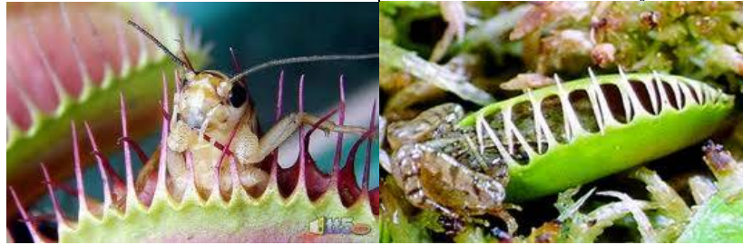
الشكل ( 1 ) يوضح نبات " النيبينش " وهو مغلق الفكبين

1 - ومن خلال المواضيع التي تدخل ضمن نطاق علم النبات هي تغذية النبات ، وتشمل تغذية النبات ليس التغذيه الطبيعيه التي تعتمد علي سحب الماء من التربه في نطاق عملية التمثيل الضوئي فحسب بل توجد انواع من النباتات التي تتغذي علي الحشرات مثل نبات " النيبينش " ( شكل 1 ) ، وهذا النبات يعتمد علي افراز ماده صمغيه تجذب الحشرات ، وعند اجتذاب الحشرة الي هذه الماده يحدث التصاق لهذه الحشرة بالماده الصمغيه وتقوم الخلايا العصبيه للنبات بغلق الفكين علي الحشره حيث تتحلل الحشره ويتغذي عليها النبات ، وهذا النبات موطنه في مدغشقر واستراليا.