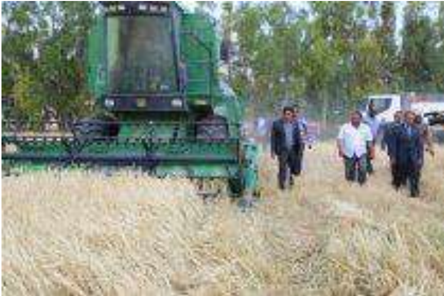
صورة (٢) جانب من أنشطة مشروع أبو شيبية