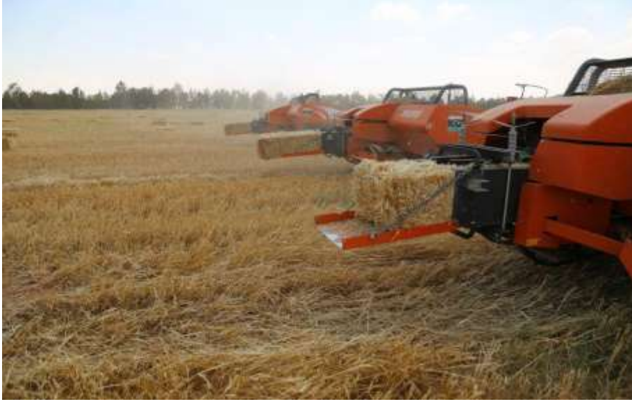
صورة (١) جانب من أنشطة مشروع أبو شيبية