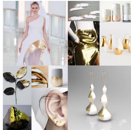
شكل (2) مثال 1 لتجميع مواد البحث وعرض التصميم