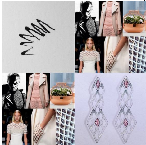
شكل (3) مثال 2 لتجميع مواد البحث والتصميم

ومن تحليل هذا البحث تظهر اتجاهات التصميم وتوجهاته من خلال القصاصات والملابس وطرق التنفيذ يتم انتاج الرسوم وتهديتها ثم تقييمها والتوصل للنتائج النهائية. وفي كل مرحلة تصميمية يتم الاستعانة بأسلوب البحث المناسب او الجمع بينهم بهدف الوصول للتصور التصميمي الواضح للمنتج القائم على المعلومات الصحيحة.