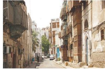
شكل (7): مدينة جدة القديمة نموذجاً للمدينة الإسلامية ذات الطابع الخاص. (19)

لقد استدعى ظهور تلك المشكلات في مدينة جدة وضع الاستراتيجيات المستقبلية للتنمية العمرانية ومشروع الحفاظ على هذه المدينة، والذي كان أحد أهم أهدافه سن القوانين الخاصة بالمباني الجديدة بالمنطقة كأحد الآليات الهامة لنجاح البرنامج، بالإضافة إلى الحفاظ على المباني القديمة الهامة وترميمها وإعادة استخدامها لاستيعاب متطلبات الحياة الحديثة، مع المحافظة على النسيج العمراني التقليدي للمدينة القديمة واستعادة نشاطها كمركز تجاري، ولتحقيق ذلك قُسمت المدينة في هذا المشروع إلى ثلاث مناطق، وصيغت سياسات الحفاظ والتنمية العمرانية الملائمة لكل منها بحيث يسهل وضع القوانين المناسبة والتنفيذ والمتابعة، ونظراً لأهمية المنطقة الأولى