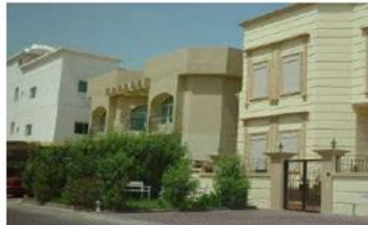
الشكل (11): غياب الطابع المعماري والهوية في المناطق السكنية لمدينة الكويت (23)