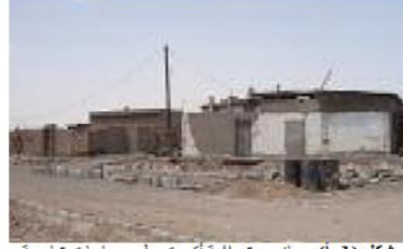
شكل (1-أ): مباني عشوائية أقيمت على مساحات شاسعة وفق تقسيمات غير معتمدة وبدون تراخيص (7)

والجدير بالذكر أنه في عام 1996م تم تطوير مخطط مدينة عدن الكبرى الذي تم وضعه في مرحلة سابقة لمرحلة دولة الوحدة؛ وذلك في محاولة لحل أزمة الإسكان وللحد من ظاهرة البناء العشوائي، وفي عام 1998م تم اعداد مخططات لذوي الدخل المحدود التي شملت توزيع 3300 بقعة أرض، ونتيجة لتزايد الاحتياجات للأراضي السكنية؛ فقد كانت هناك صعوبة في استيعاب الأعداد الكبيرة من طلبات الأراضي، فتم اقرار مشروع الجمعيات السكنية ضمن مخططات بمساحة تقدر بـ 16 كم 2 (10) وبالرغم من ذلك لم تساعد كل هذه الاجراءات في معالجة الوضع المزري الذي وصل إليه واقع البناء في المناطق السكنية لمدينة عدن.