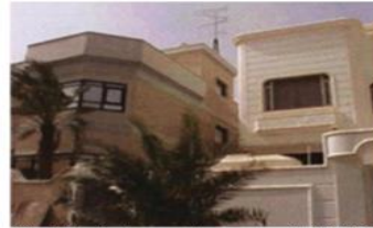
الشكل (10): التهدي على حقوق الجار بسبب المساكن المتلاصقة (23)