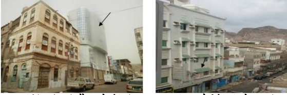
شكل (3): مباني سكنية بمفردات وطرق تشكيل مستوردة، ومواد تشطيب للواجهات لا تتسجم مع البيئة العمرانية التقليدية *