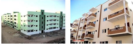
شكل (6): عمارات سكنية بمفردات سطحية معاصرة من أحد المشاريع السكنية الخاصة (مدينة إنما) في مدينة عدن وهو من الأحياء السكنية الجديدة التي تم انشاؤها على عدة مراحل بعد 1990م (16)

وتشير الإحصائيات لعام 2000م وحسب ما جاء في كتاب الإحصاء السنوي للجهاز المركزي لعام 2001م بأن عدد سكان محافظة عدن بلغ حوالي "526 ألف" نسمة ومساحتها قدرت بـ"3460 كم 2 " حسب استطلاعات السكان المقيمين لعام 2000م (5) ، وفي عام 2002م بلغ عدد السكان حوالي "900 ألف" نسمة، وبهذه الزيادة السكانية المضطردة زاد حجم التوسع العمراني؛ الأمر الذي كان له انعكاساته الكبيرة على العمارة في المناطق السكنية وما زال كذلك حتى الآن؛ مما يستدعي بالضرورة إجراء عملية إنقاذ للبيئة العمرانية السكنية في هذه المدينة عبر المنظومة التشريعية للتخطيط والبناء كأحد أهم آليات العمارة في المدن اليمنية التاريخية ولإعادة تنظيمها وصياغتها، والسؤال الذي يطرح نفسه هو: هل كان لقوانين وتشريعات البناء اليمنية الصادرة خلال مرحلة دولة الوحدة دوراً فيما آلت إليه أوضاع العمارة في المناطق