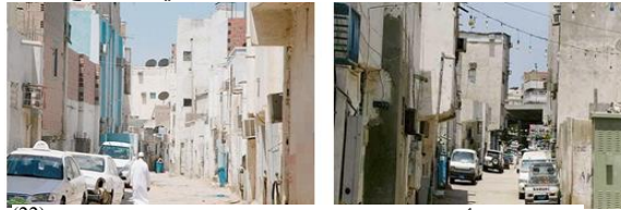
شكل (9): أحياء سكنية عشوائية في مدينة جدة القديمة (22)

ومن وجهة نظر الباحثين فإن تخصيص الدليل لأربع أنواع من المساحات السكنية في المدينة ومن بينها المناطق العفوية أي التي تُبنى بدون تخطيط مسبق (العشوائية) هو اعتراف من أمانة جدة بهذه المشكلة والتعاشي معها واعتبارها جزء من تاريخ هذه المدينة وتراثها في مرحلة ما، ولكنها وحسب تقارير حديثة فقد تفاقمت هذه المشكلة إلى الحد الذي أصبحت تشكل فيه ظاهرة سلبية في المدينة، وبحيث لم يعد يُحسب الإعتراف بهذه المناطق لأمانة المدينة وإنما عليها؛ فقد كشفت تقارير ومسوحات طبوغرافية حديثة عن وجود 45 منطقة عشوائية في مدينة جدة على مساحة تعادل ثلثي مساحة البناء فيها، وبحسب تقرير لصحيفة "عكاظ" السعودية فإن البدايات الأولى لظهور أحياء العشوائيات في جدة تعود إلى مطلع السبعينيات من القرن الماضي طبقاً لمعلومات ذوي الاختصاص، وتحديداً عندما بدأت المدينة في استقطاب سكان الحضر والأرياف للعمل فيها، ونظراً لحاجتهم للسكن السريع وعدم القدرة على توفيره؛ اضطروا إلى وضع اليد على الأراضي وبناء المساكن بطرق متواضعة ومواد بناء بسيطة مما أدى إلى ظهور العشوائيات شكل (9). (21) ويظهر هنا التأثير السلبي للعوامل الاجتماعية والاقتصادية على التشكيل العمراني والطابع المعماري للمدينة القديمة.