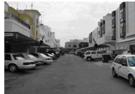
الشكل (12): تعدد أشكال مظلات السيارات وألوانها يعتبر من أسباب ضياع ملامح الواجهات والتلوث البصري (23)

ونتيجة لكل ما سبق فقد كان من الضرورة أن تعيد بلدية الكويت النظر في قوانين البناء المعمول بها بشكل مستمر، فتمخّص عن ذلك: