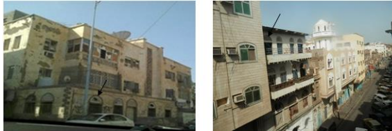
شكل (4): مباني سكنية في أحياء عدن استخدم فيها القرميات وهي من مفردات العمارة الصناعية *