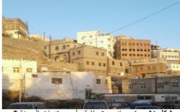
شكل (1-ب): مباني عشوائية على مرتفعات المدينة*

وقد ترتب على قيام الدولة الجديدة عام 1990م تغيير في النظم والقوانين الشطرية، واستغرقت صياغة القوانين فيها وقت طویل لبيتسنى للقائمين عليها ترتيب الأمور، فنتج عن ذلك ظهور البناء غير الآمن، ومناطق البناء العشوائي* التي أمتدت لتتضي على المناطق المسطحة والمنحدرات الجبلية القريبة من مناطق الخدمات وضواحي المدن الرئيسية والثانوية. (3) انظر للشكلين (1-أ) و (1-ب).