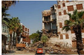
شكل (8): إهمال الحديد من المباني القديمة في مدينة جدة أدى إلى ضياح جزء كبير من تراثها وتشويه طابعها المعماري. (20)

(د) تطوير شبكات الطرق والمرافق والخدمات العامة أدى إلى ضياح الوجه الحضاري للمدينة، حيث لم يؤخذ دخول السيارات إلى المدينة في الاعتبار عند التخطيط لها؛ وبالتالي لم يكن من السهل دخول سيارات الخدمة والطوارئ إليها. (18)