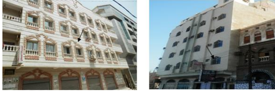
شكل (5): مباني سكنية بمفردات دخيلة على العمارة العدنية المحلية في أهم أحياءها التاريخية *