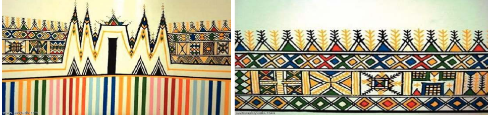
شكل (١) نماذج من النقش العسيري (٢)

التي تمتاز بتعدد ألوانها" ويعطى الجدران والسقوف والابواب تميز وكانت بيوت عسير تلتهم الالوان بينهم والفضل في ذلك يعود لنساء المنطقة اللواتي يزين بيوتهن بالعفوية التي يشدو بها الغريد وفي دراسة موجيه التي أنجزها عام ١٩٩٥م برز فن القط العسيري الذي سجلته اليونسكو مؤخرا ضمن القائمة التمثيلية للتراث العالمى غير المادى كأهم عنصر جمالى درسه موجيه بشكل عام" (١)