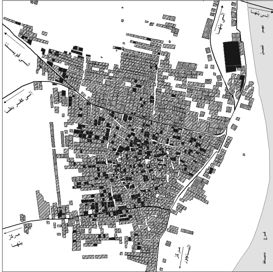
شكل رقم ( 21 ) إرتفاعات المباني في قرية بطا في عام 2008م