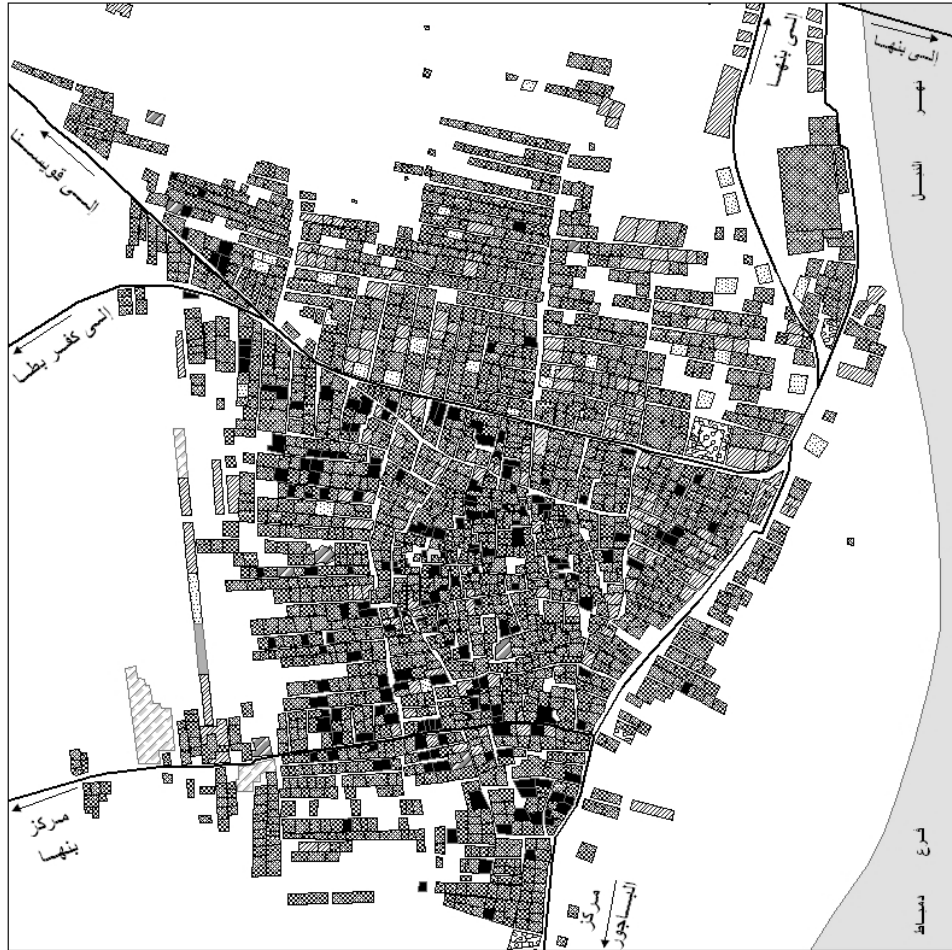
شكل رقم ( 20 ) إستخدامات الأراضي في قرية بطا في عام 2008م