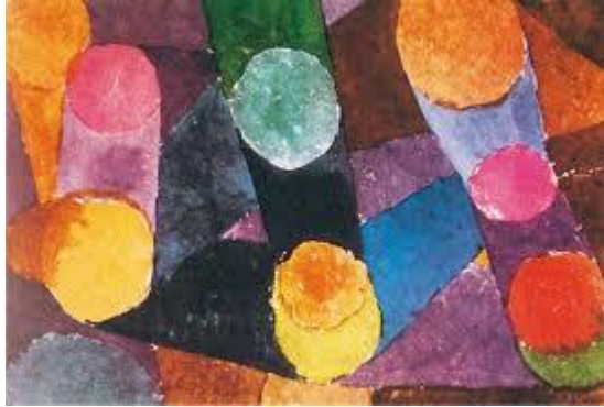
صورة رقم (٤) من اعمال الفنان بول كلي

مدرسة الباوهاوس افكارها ومبادئها والاستفادة منها في انتاج مشغولة فنية مبتكرة إعداد : أ.د / رحاب محمد ابو زيد، أ.د / محمود حسنين عشعش، أ.م.د / داليا المحمدى محمد حمودة أ/ ندا ناصف ابراهيم مصطفى