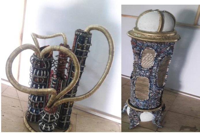
شكل (٧) صورة من تنفيذ الباحثة

مدرسة الباوهاوس افكارها ومبادئها والاستفادة منها فى انتاج مشغولة فنية مبتكرة إعداد : أ.د / رحاب محمد ابو زيد، أ.د / محمود حسنين عشعش، أ.م.د / داليا المحمدى محمد حمودة أ/ ندا ناصف ابراهيم مصطفى