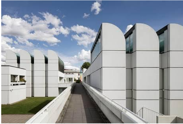
صورة رقم (١) من اعمال الفنان فالترجروبيوس يوضح فيها شكل النصب التذكارى

الفنان فالترجروبيوس Walter Gropius (١٨٨٣ - ١٩٦٩)