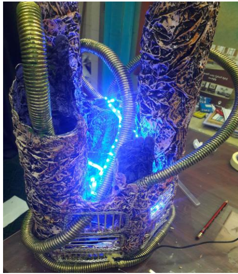
شكل (٨) صورة من تنفيذ الباحثة