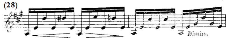
شكل رقم (٤-ب)

العبرة الثانية بالفكرة الثانية B من م(٢٦)- (٢٩) عند الجيتار