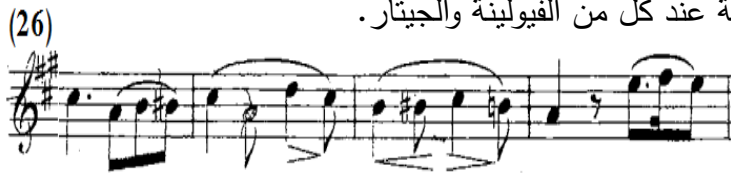
شكل رقم (٤-أ)

الثانية بالفكرة الثانية عند كل من الفيولينة والجيتار.