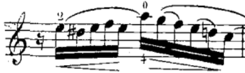
شكل رقم (٢٧) الفلاوتاتو في م (١١)