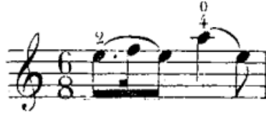
شكل رقم (٢٦) الفلاوتاتو في م (٢)