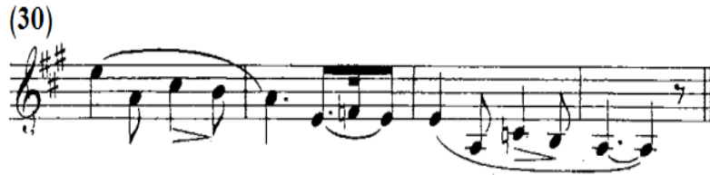
شكل رقم (٥-أ)