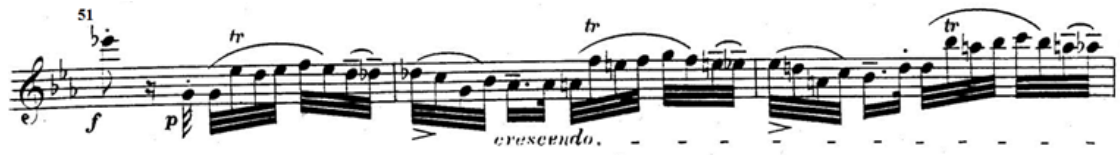
شكل ( ٧ )

من م (٥١) : م (٥٨): استخدام لحلية الترعيد جاءت ما بين (بعد صوتي ونصف بعد) وجاءت علي النبر الضعيف في التريل كروش الثاني في ظل وجود الرباط اللحني