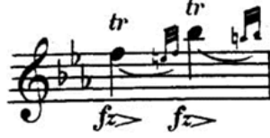
شكل ( ٦ )

قام باستخدام حلية الترعيد المزيل مع اصطحابها بضغط مفاجئ fz في الأوكتاف الثاني .