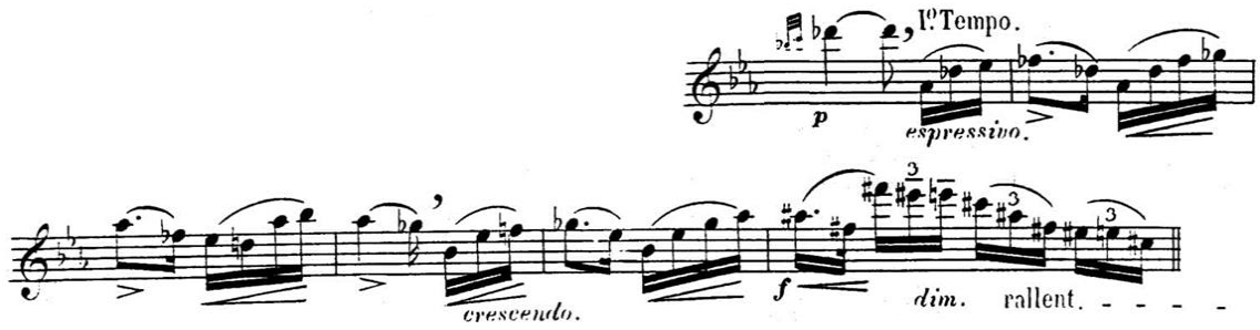
شكل ( ١٥ ) توضيح أماكن التنفس

من م (٧٨) : م (٨٣): قام بتحديد مكان للتنفس في مازورة ٧٨