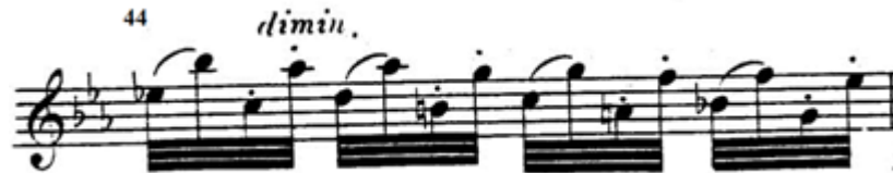
شكل ( ٢٠ )

استخدم مسافة الخامسة والسادسة الهابطة مع استخدام slur