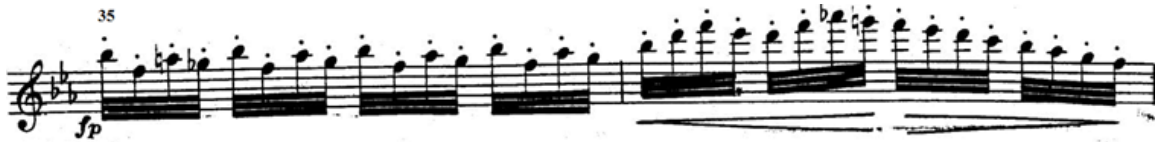
شكل ( ٩ ) ضربات اللسان المزدوجة

من م (٣٣)إلي م (٤٣) قام باستخدام ضربات لسان مزدوجة في الأوكتاف الثاني والثالث للآلة .