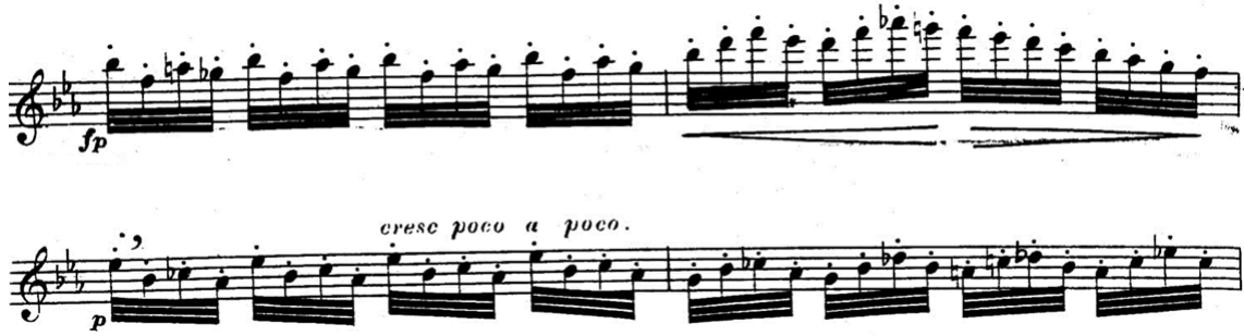
شكل ( ١٤ ) توضيح أماكن التنفس

من م (٧٨) : م (٨٣): قام بتحديد مكان للتنفس في مازورة ٧٨