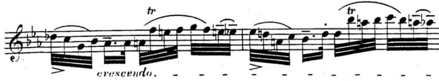
شكل (١٢) توضيح التتابع اللحني

مازورة (٥٢): إلي مازورة (٥٣) تتابع لحنى صاعد لمازورة (٥١).