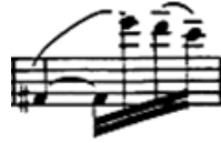
شكل ( ١٨ )

كما استخدم أيضا مسافة (فا: مي ٢) في مازورة (١١) مما يحتاج إلي التحكم في النفس مع وضع شد الشفاه sharp .