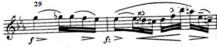
شكل ( ١٩ )

في مازورة (٢٩) استخدم الأداء القوي forte ثم استخدام الضغط المفاجئ fz