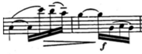
شكل ( ١٧ )