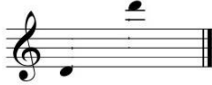
المدى الصوتي لآلة الشبابة

وهي من الآلات الموسيقية المتوارثة، مصنوعة من المعدن، لها ٥ ثقوب (وهي مثل آلة السُلَامِيه مع أختلاف الخامة المصنعة منها وهي قصب الغاب)، وهي الآلة التي تستخدم في العزف للعديد من الأغاني الشعبية وأغاني جمع المحاصيل واحتفالات الطهور والسبوع وغيرها، و تصنع آلة من المعدن لكي يكون الصوت المسموع به حده و لمعه وتُعزَف الشبابة بالنفخ مباشرة على حافة فوهتها بطريقة معينة فتصدر الصوت، و في بعض الأحيان تبدأ من نغمة do و المدى الصوتي للآلة تقريباً ٣ أوكتاف، و في معظم الأحيان لا يعزف على الأوكتاف الأول لإنخفاض صوت النغمات.