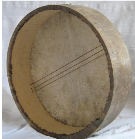
ظهر آلة البندير موضحة خيوط مشدود خلفها .

و لآلة البندير أسماء عديدة فى أماكن أخرى مثل الدُف و الطار بمنطقة ، هوعبارة عن دائرة من الخشب، قطرها حوالي ٤٠ سم تقريباً و هو من آلات النقر ذات فصيلة الوجه الواحد، و مزود من خيوط رفيعة من أمعاء الحيوانات أو من النايلون حديثاً مشدودة بطول قطر الرق الجلدي المصنوع من جلد الماعز و عند الضرب على البندير يحدث اهتزازات صوتية تُحدث صوت خشن مصاحب لصوت الضربات إحدى الآلات الرئيسية فى ضبط الإيقاع الموسيقي، ولذلك فهو يعتمد فى مصاحبة كثير من أنماط الموسيقى الشعبية ، و تستخدم فى واحة سيوة مصاحبة لحفلات الزفاف و حلقات الذكر الصوفية التى تُقام و يستخدمها النساء.