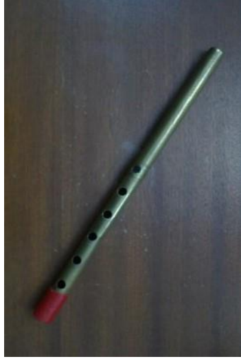
آلة الشبابة ( تشببت )