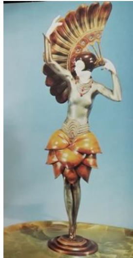
شكل رقم (١٤) للمصمم Philip fan Dancer، مصنوع من خامه البرونز والعاج، وتبلغ أبعاده حوالى ١٨ x ٤٦ سم [ثانيا: ٥ - ص ٥٧]

كما توجد نماذج نحتيه تتبع مدرسه الأرت ديكو تصلح لأن تكون وحدات إضاءة ومن هذه النماذج: