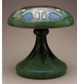
شكل رقم (٢) Mushroom Lamp ، من تصميم Fluber Pottery Company ، وحده إضاءة تشبه المشروم مصنوعه من الفخار مع بلورات خضراء وألواح داخلية من الزجاج الملون ويبلغ ارتفاعها ٥,٧ سم [ ثانيا : ٣ - ص ٥٣ ]