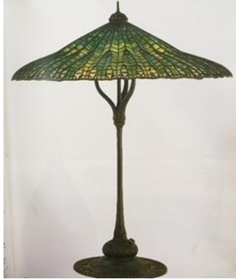
شكل رقم (٤) ، من تصميم Louis Comfort Tiffany ، 1900 ، وحده إضاءة مصنوعة من الزجاج المحتوى على رصاص وبرونز ويبلغ ارتفاعها ٣١,٥ سم [ ثانيا : ٣ - ص ٩١ ] .