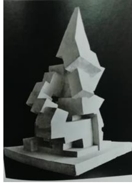
شكل رقم (١٢) للمصمم Johannes Itten، ١٩١٩، الجص، استخدم الفنان أسلوب التكعيبية في هذا العمل الفني [ثانيا: ٤ - ص ٤١٩].