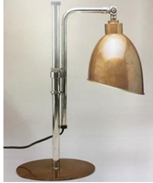
شكل رقم ( ٩ ) للمصمم Dell Christian ، ١٩٢٨ ، إضاءه طاوله مصنوعه من المعدن المطلى كروم مما يجعلها تشبه النحاس ويبلغ إرتفاعها ٤١,٩ سم [ ثانيا : ٣ - ص ١٧٠ ] .

الباوهاوس على التقاليد الفنية والتصميمية المعاصرة والسابقة لها ، وترى أن جوهر العمل الفني لا يتأثر بتغيير الشكل الظاهري له ، أكدت على أهميته إيجاد توافق بين كل من : الفن وأدوات الحياه - الفن والصناعة - الفن والحياه اليوميه وحققت ذلك بجعل العماره عامل وسبب بين جميع هذه العلاقات ، ومن هنا كان إختيار إسم المدرسه Bau Haus وهى كلمه ألمانيه الترجمة الحرفية لها تعنى بيت العماره . . ولم يكن هدف العمل الفني إبتكار الشكل من أجل الشكل وإنما تطويره ليتلاءم مع الهدف والوظيفه . إتخذ مصممى الباوهاوس أسلوب مختلف فى العمل التصميمى بسبب الظروف السياسيه والإقتصادية والإجتماعيه المتدهوره يشمل تجنب الخامات التقليديه النادرة الوجود والتوجه إلى خامات مصنعة ضئيلة التكلفة كالمواسير المعدنية ، دمج الفن بالمهارات التقنيه [ أولا : ٦ - ص ٢٠١ ] ويتضح هذا فى أعمالها شكل رقم (٩) ، (١٠)