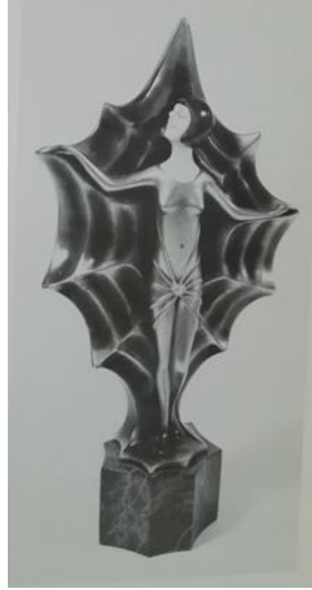
شكل رقم ( ١٥ ) The Winged Dancer ، للمصمم Ronald Paris ، مصنوع من خامة البرونز والعاج وقاعده رخاميه ٨,٧٥ x ٢٢,٢٥ سم [ثانيا : ٥ - ص ٥٩] .