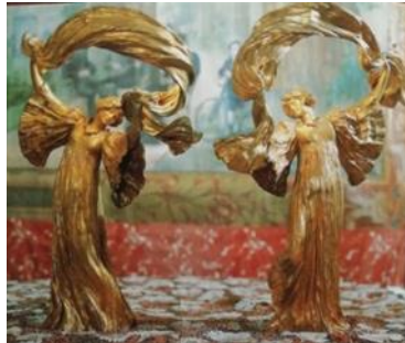
شكل رقم (٦) للمصمم : Agathon Leonard ، ١٩٠٣ ، ويمثل الشكل مصباحان مذهبان من البرونز على شكل راقصين [ ثانيا : ٦ - ص ٢٠٠ ] .