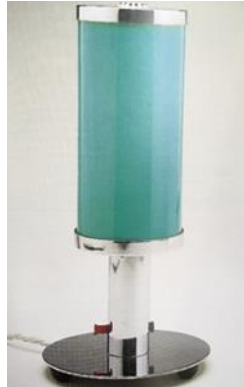
شكل رقم ( ١٠ ) للمصمم Fritz August Breuhaus ، ١٩٢٨ ، إضاءه طاوله مصنوعه من الزجاج والمعدن المطلى بالكروم ويبلغ إرتفاعها ٢٩,٢ سم [ ثانيا : ٣ - ص ١٧١ ] .

وفيما يلى بعض النماذج لمنحوتات يرتبط تصميمها بفلسفه حركه الباوهاوس تصلح لأن تكون وحدات إضاءه :