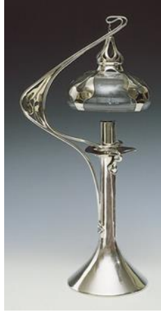
شكل رقم (١) Candle lamp ، للمصمم Kate Harris ، 1900 ، وحده إضاءة ذات قاعده فضيه وحوامل فضيه فى شكل عضوى يبلغ ارتفاعها ٣٨,١ سم [ ثانيا : ٣ - ص ٣١ ] .