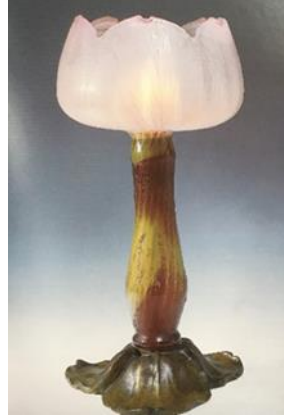
شكل رقم (٣) Corolla lamp ، للمصمم Emile Galle ، 1900 ، وحده إضاءة من الزجاج تأخذ شكل زهره لوتس مفتوحة يبلغ ارتفاعها ٤٧ سم [ ثانيا : ٣ - ص ٨٩ ] .