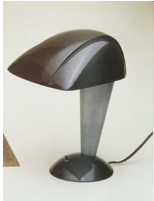
شكل رقم (١٣) للمصمم Walter Dorwin Teague ، ١٩٣٤ ، وحده إضاءة من الألمنيوم والباكليت يبلغ إرتفاعها حوالى ٣١,١ سم [ثانيا: ٣ - ص ٢٠٠]، يظهر فيها أسلوب الحركة فى البعد عن التفاصيل والبساطة.

كما توجد نماذج نحتيه تتبع مدرسه الأرت ديكو تصلح لأن تكون وحدات إضاءة ومن هذه النماذج: