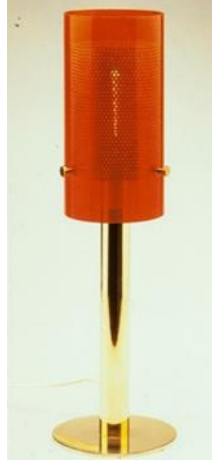
شكل رقم (١٢) ، للمصمم Haj Markaryd ، ١٩٥٠ ، وحده إضاءة لطاوله مصنوعه من النحاس الصلب ومثقوب بظل زجاجى دانرى [ثانيا: ٣ - ص ١٩٦] يتضح فيها أسلوب الحركة الذى يتميز بالبساطة .