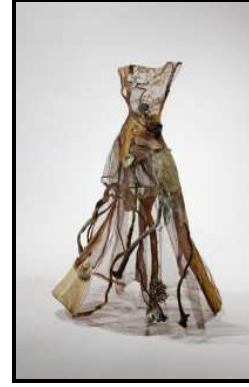
صورة رقم ( ٢٢، ٢٣، ٢٤ )