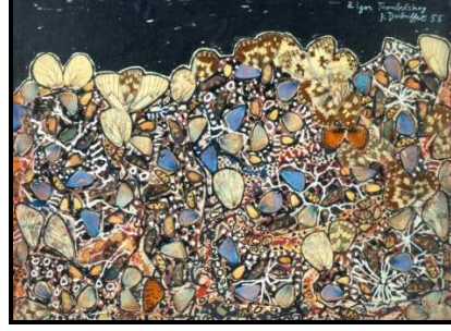
صورة رقم (٤)

"الطائر في الضوء" للفنان جان دوبوفيه عام ١٩٥٩م المقاس: ٧٤ X ١١٦