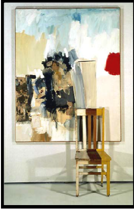
صورة رقم (٦)

تحليل العمل الفني: العمل عبارة عن مساحة مستطيلة الشكل يكسر إطار حدود العمل كرسى حقيقي أمام اللوحة من جهة اليمين، وجزء من هذا الكرسى موجود داخل إطار العمل وجزء منه خارج إطار العمل.