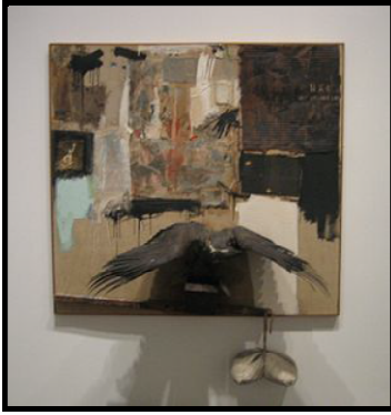
صورة رقم (٧)

تحليل العمل الفنى: العمل عبارة عن مساحة مربعة الشكل مصنوعة من الخشب ،يخرج من إطار العمل كيس متدلى بحبل من أسفل اللوحة التشكيلية عن اليمين ،وينقسم التكوين إلى مساحات مستطيلة هندسية وبأسفل العمل رمز لطائر ناشر جناحيه .إستخدم الفنان فى هذا العمل الصياغات التصويرية مع الأشكال الطبيعية المحنطة وذلك من خلال استخدام الفنان لطائر محنط مثبت على قاعدة ،كما يتدلى كيس منتفخ بالحبال معلق فى أسفل اللوحة ،بالإضافة إلى إستخدام الفنان لأشياء جاهزة الصنع فى العمل الفنى مثل قطع نسيج وقطع معدنية .