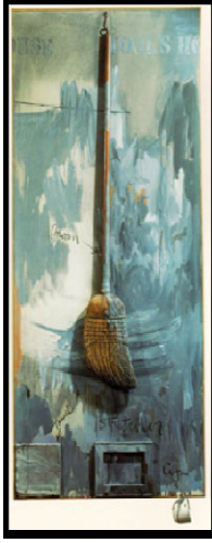
صورة رقم (٨)