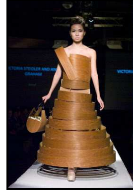
صور رقم ( ٢٠ ، ٢١ )

تصميمين في عرض خريف /شتاء عام ٢٠٠٠ بعنوان "After words" لمصمم الأزياء " حسين تشاليان"