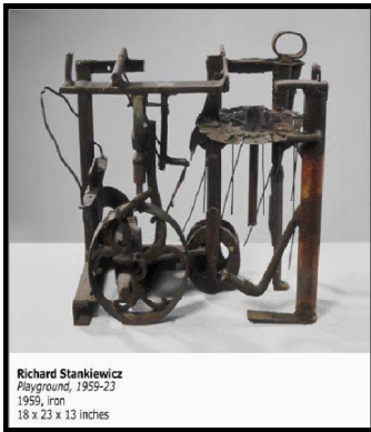
صورة رقم (٩)