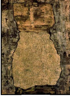
صورة رقم (٥)

والورق المضغوط حيث كان "دوبوفيه" يبحث عن المتخيل واللاواقع في أعماله الفنية صورة رقم (٥). وفي عام ١٩٦١م أقيم معرض بعنوان "الفن التجميعي" بمتحف الفن الحديث بنيويورك، عرضت فيه أعمال فنية لفنانين أوروبيين تعود إلى بواخر القرن العشرين، مثل: جورج براك، دوبوفيت، دوشامب، بيكاسو، وروبرت روشنبرج . " (غاستون باشلار: د.ت: ٧٤)