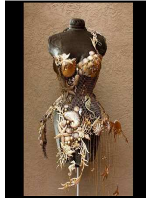
صور رقم (٢٥، ٢٦، ٢٧)

تصميمات لعرض "الكسندر ماكوين" صيف /ربيع عام ٢٠٠٣