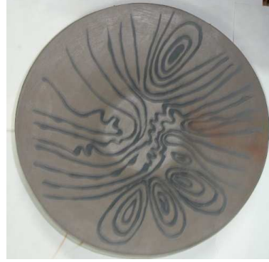
شكل ( ٣ )

طبق من البول كلي منفذ عن طريق التخطيط بالقطارة وملئ الفراغات باللون عن طريق الفرشاة وقد اثبتت التجربة نجاح الخلطة وتماسكها مع الشكل وتزججها بعد الحرقة الاولى