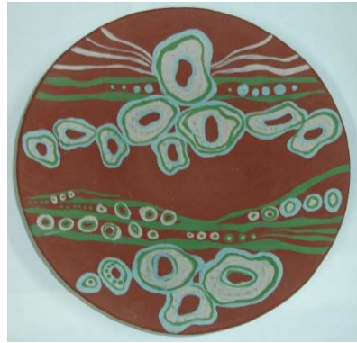
شكل ( ٤ )

طبق منفذ باستخدام تقنية العزل بالورق المشكل وتقنية رش البطانة بالبخاخ واستكمال التصميم عن طريق أدوات الرسم علي السطح الخزفي ويوضح الشكل خطوات التنفيذ ويوضح الطبق بعد الحريق وقد اثبتت التجربة نجاح الخلطة وتماسكها مع الشكل وتزججها بعد الحرقة الاولى