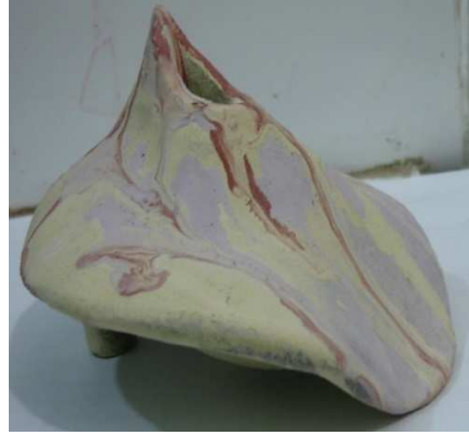
شكل ( ١٤ )

إناء من الطين الأسواني وآخر من البيول كلي منفذ باستخدام تقنية الترخيم والبطانة مطبقه اثناء مرحلة التجليد باستخدام خلطات البحث ويوضح الشكل نجاح الخلطة وتماسكها مع الشكل والتزجيج من الحريق الاول