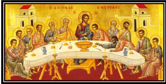
أيقونة " العشاء السري المقدس " القرن ١٨ مكان " كنيسة سانتا ماريا ديلي/ شمال إيطاليا "، النوع " قبطية " المادة " رسم جدارى فريسكو " ٥٣٢ X ٣٠٨ سم