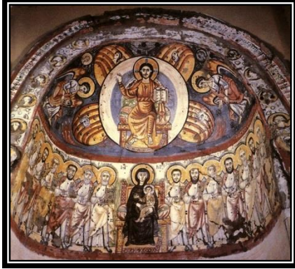
أيقونة " الصعود " القرن ٧ مكان " كنيسة باويط باذن من المتحف القبطى / القاهرة "، النوع " قبطية " المادة " رسم جدارى فريسكو " ٧٧١ X ٨٥٠ سم