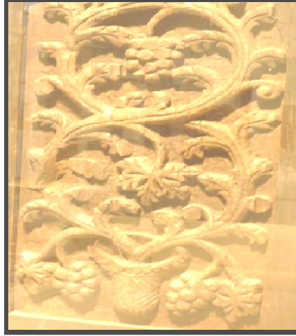
شكل (٨) (٣)

وتذكرنا هذه القطعة بزخارف الفسيفساء فى قبة الصخرة فى القدس وبزخارف قصر المشتى فى البادية الأردنية ، ومن الجدير بالذكر أن فنانى العصر الإسلامى قد أطلقوا يد الفنان فى استخدام ورقة العنب كموضوع لزخارفهم التى أخذت تتطور تدريجياً (١) ، وعلى الرغم من أن حركة اندماج الأغصان المذكورة تعتبر ابتعاداً عن الطابع الهيلينستى وتحويلاً عن الطبيعة الذى يعد ميزة للزخرفة العربية الإسلامية إلا أنها لا زالت تحتفظ ببعض العناصر والظواهر الهيلنستية والبيزنطية مثل أوراق الشجر البيضوية ذات المحيط المسنن والتعرق النخلى وأوراق العنب الخماسية وحببيات عناقيده الجلدية ، وكذلك الشقوق التى تتخلل العروق ، والتجسيم الناتج عن تحذب قطاعات العناصر وتفاوت مستوياتها (٢) .