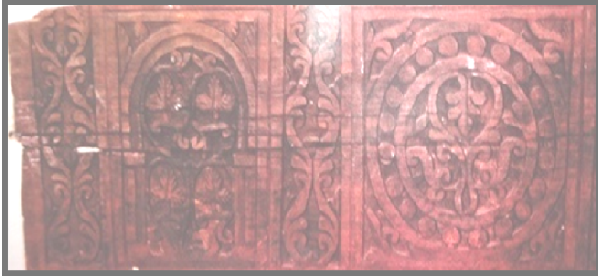
شكل (٩) (٢)

ونلاحظ وضوح التأثيرات الساسانية المتمثلة فى الدوائر المملوءة بحبات مستديرة كما نلاحظ التأثيرات الهيلينستينية المتمثلة فى عناقيد وأوراق العنب والورقة النباتية الثلاثية البتلات والفروع المنثنية التى تحصر بينها وحدات زخرفية، وهذه اللوحة تبين الطبيعة الإزدواجية التى تميز بها الفن الأموى (١) ، ويتحقق في التصميم الإيقاع والإتزان وحسن اختيار الزخارف النباتية حتى تتماشى مع الشكل العام وذلك من خلال اختياره لورقة العنب الثلاثية ورقة العنب الخماسية من خلال التكرار والتماثل، وقد تم تنفيذها بعدة مستويات من الحفر البارز والغائر .