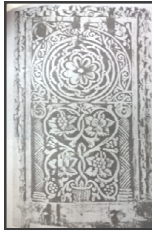
شكل (١) (٤)