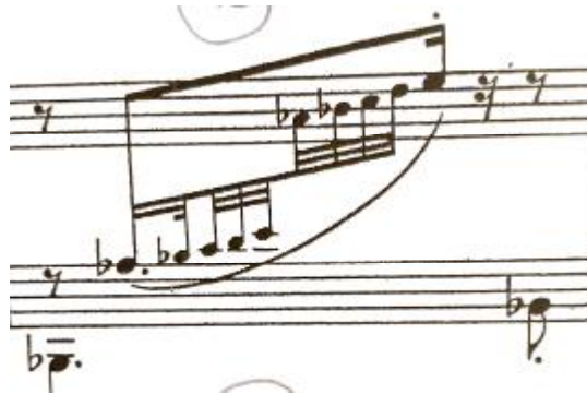
شكل رقم (١٣)

يوضح السلم الخماسي Pentatonic في مازورة ٥٧ بالجزء الثالث