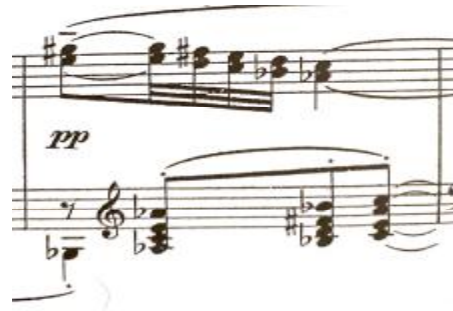
شكل رقم (٤)

يوضح تألف ناقص في المازورة ١٥ بالجزء الأول