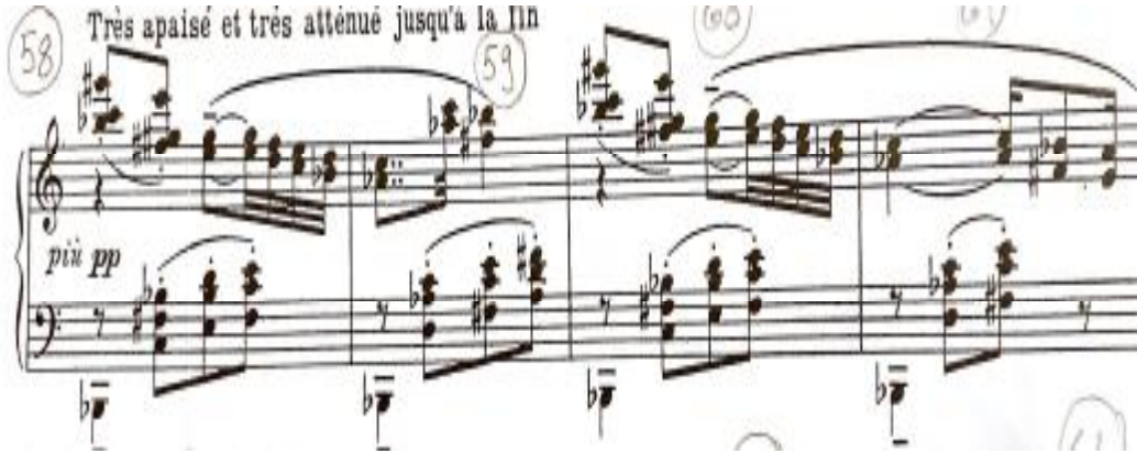
شكل رقم (١٨)

١٨- ظهور إيقاع ثابت ومتكرر في كل مازورة في خط الباص