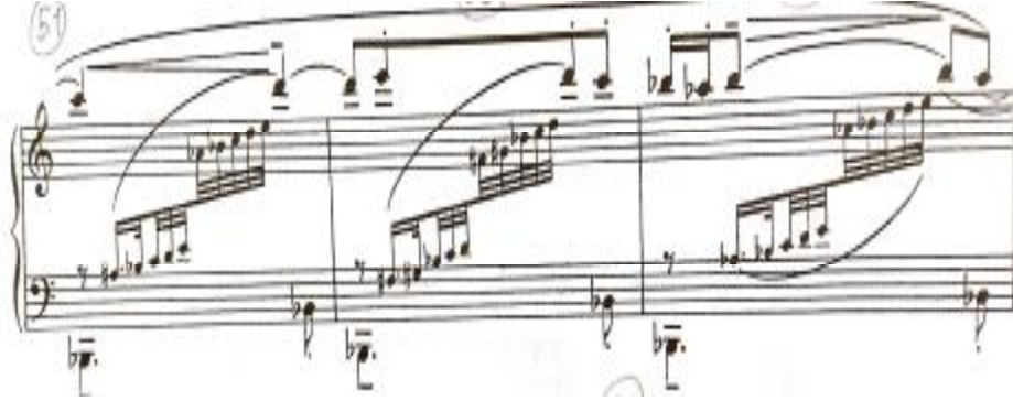
شكل رقم (١٤)

١٣- ظهور إيقاع ثابت ومتكرر في كل مازورة في خط الباص