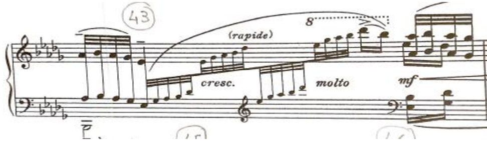
شكل رقم (٨)

يوضح السلم الخماسي Pentatonic في مازورة ٤٣ بالجزء الثاني