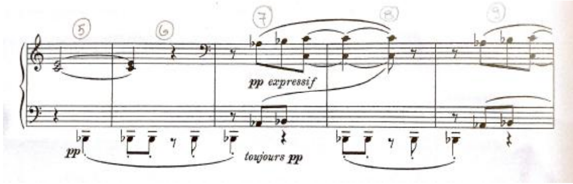
شكل رقم (٣)

٢- ظهور إيقاع علي نغمات التمباني مع هارمونيات رأسية والإحتفاظ بخط الباص وإيقاع بسيط غير مُربك: