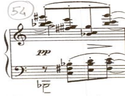
شكل رقم (١٥)

يوضح التآلف الزائد في مازورة ٥٤ بالجزء الثالث