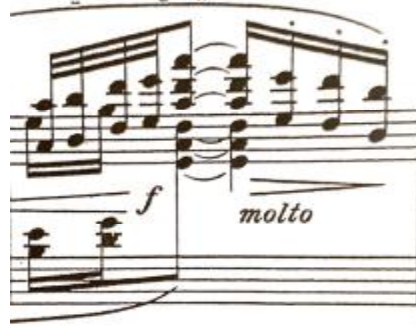
شكل رقم (١٠)

يوضح إتفاقيات الرباعيات Mystic Chords في مازورة ٤٤ بالجزء الثاني وظهرت في الموازير أرقام ٤٣-٤٤ وهي من اهم المميزات والأساليب التي يستخدمها ديبوسي في التأليف وظهرت في موسيقي السايكيدليك وتري الباحثة أنها تعطي إحساس بالغموض.