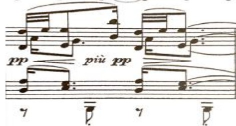
شكل رقم (١١)

يوضح تعدد الإيقاع Polyrhythm في المازورة ٤٦ بالجزء الثاني وظهرت في الموازير أرقام ٤٣:٤٦ و ذلك بسبب إعادة استخدام الطرق القديمة وأساليب تعدد التصويت، وهذا أدى لتنوع كبير في شكل تكوينات إيقاعية فريدة أظهرت تعدد الإيقاع.