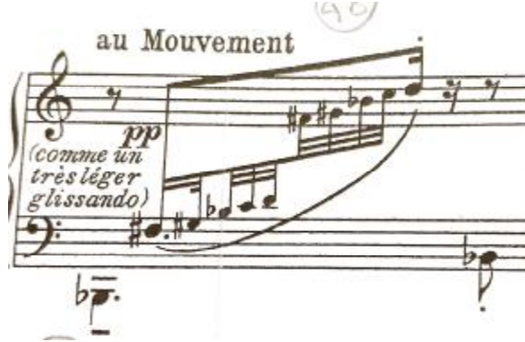
شكل رقم (١٢)

يوضح السلم السداسي Hexaphonic في مازورة ٤٨ بالجزء الثالث