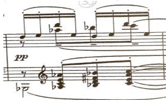
شكل رقم (٥)

وظهرت في الموازير أرقام ١٥-١٧-١٩-٣٣-٣٤ استخدام التآلفات الغير تقليدية وهو الشئ الأكثر شيوعاً والمناسب لموسيقى السايكيديليك. ٤- حركات متوازية بين الباص والسوبرانو: