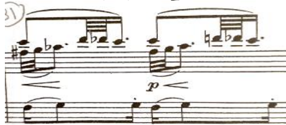
شكل رقم (٦)

٥- تكوينات إيقاعية أدت لظهور تعدد الإيقاع Polyrhythm