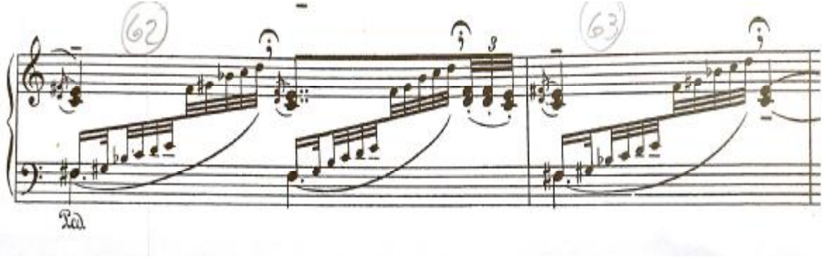
شكل رقم (١٨)

يوضح السلم السداسي Hexaphonic في الجزء الرابع