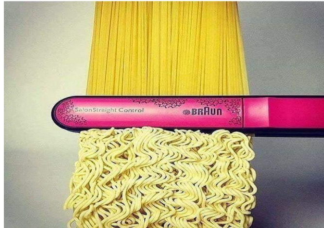
Figure 1 Publicité de BRAUN https://i.imgur.com/zpT3DOi.jpg

Évidemment, la multimodalité dans l'image publicitaire a ainsi pour but de transmettre un message et de rendre la communication compréhensible de manière attractive à l'aide de plusieurs éléments. Le terme de Multimodalité , en anglais multimodality , provient des travaux de Gunther Kress (2003). La multimodalité a été introduite en français dans son sens sémiotique avec l'ouvrage de Lebrun, Lacelle et Boutin (2012). Selon ces auteurs, ce terme désigne : « l'usage, en contexte réel de communication médiatique, de plus d'un mode sémiotique pour concevoir un objet ou un événement sémiotique. » 6 Pour définir précisément le concept de ce terme, on peut dire que la multimodalité constitue un puissant moyen d'expression verbale ou non verbale qui vise à produire du sens. D'ailleurs, ce moyen d'expression peut être du texte, d'icône, de couleurs et de sonore et ainsi de suite. Prenons à titre d'exemple cette annonce de site web: