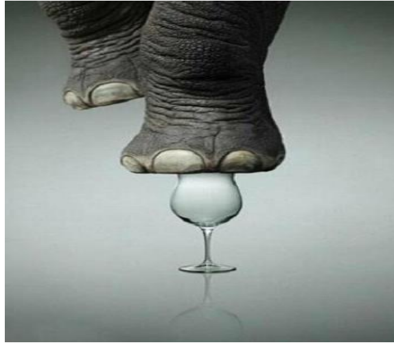
Figure 6 http://www.5reb.com/post

Avant d'analyser cet exemple, nous pouvons dire que cette annonce imagée fixe repose essentiellement sur l'aspect iconique. C'est une image symbolique qui indique une extra résistance à un produit de Rocco pour les gobelets en verre. Cette annonce de site web signifie un verre à vin n'était pas cassée même si les pieds de l'éléphant marchaient dessus. Il s'agit d'une publicité totalement créative qui s'appuie sur l'élément iconique sans recourir à des unités linguistiques, parce que cet élément iconique est plus expressif et ne nécessite aucun autre élément.