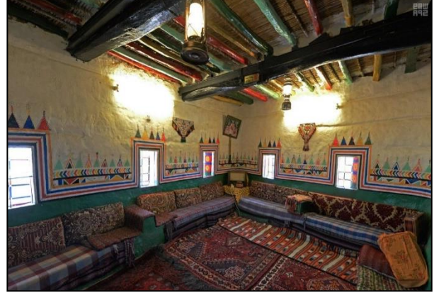
زخارف القبط العسيري في العمارة التقليدية بعسير 13