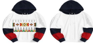
ثانياً : التيشيرتات: التصميم الأول: