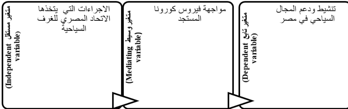
شكل 1: إطار البحث

نجد أن هناك ضرورة لتناول لتقييم الإجراءات التي يتخذها الإتحاد المصرى للغرف السياحية لمواجهة فيروس كورونا المستجد لتنشيط ودعم المجال الفندقى في مصر.