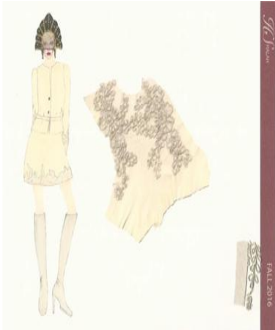
شكل (٧) تصميم حديث مستوحى من الطراز الروسي القديم عبارة عن قطعتين جاكيت وجونبلا من الجلد الطبيعي والدانتيل مع وجود عينات من الاقمشة. تصميم "رقم ١"