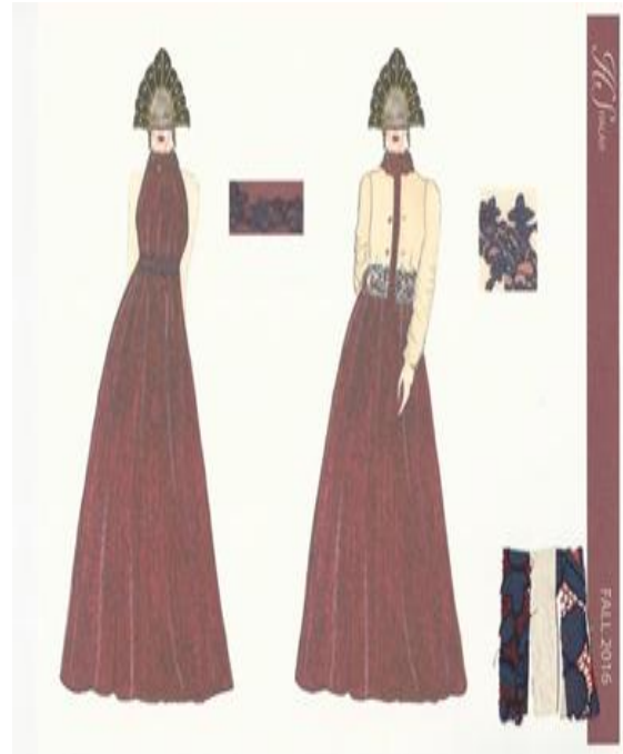
شكل (١٤) تصميم حديث مستوحى من الزي الروسي "السارافان" عبارة عن فستان من الدانتيل مطرز بالخرز وجاكيت من الجلد الطبيعي مطعم بالدانتييل المطرز يدويا مع وجود عينات من الاقمشة. تصميم "رقم ٧،٦"