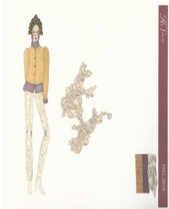
شكل (١٦) تصميم حديث مستوحى من الطراز الروسي "الدوشاغريا" القديم عبارة عن بنطلون من الجلد الطبيعي مطعم بالدانتييل المطرز يدويا وجاكيت وقميص داخلي من الحرير مع وجود عينات من الاقمشة. تصميم "رقم ٨"