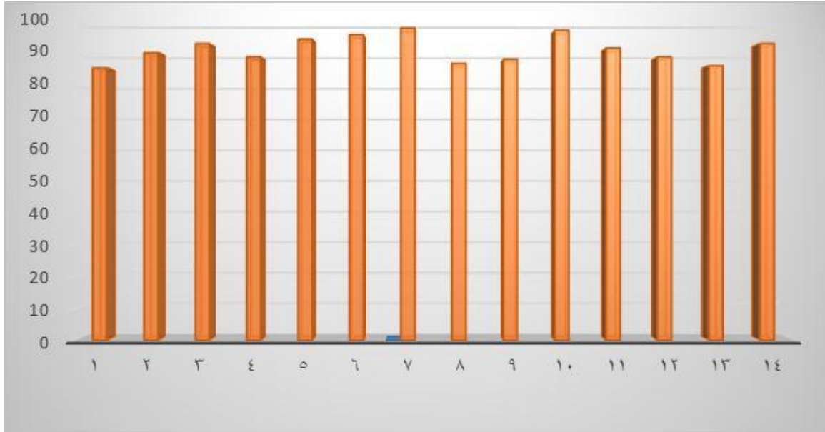
شكل (٢٣) رسم بياني يوضح متوسط تقييمات المحكمين للتصميمات المنفذة بالبحث للمحاور الثلاثة