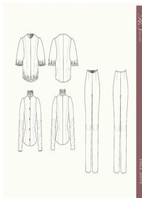
شكل (٢١) شرح تفصيلي للموديل صمم عن طريق برنامج Adobe illustrator