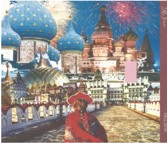
شكل (٢) لوحة مصادر الالهام لألوان الأقمشة المستوحاة من المباني الروسية القديمة صممت عن طريق برنامج Adobe Photoshop