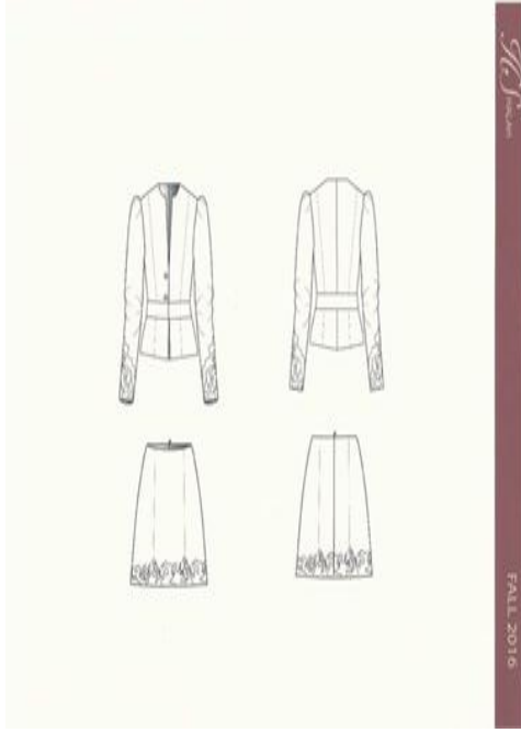
شكل (٧) شرح تفصيلي للموديل صمم عن طريق برنامج Adobe illustrator