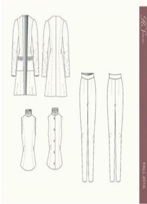
شكل (١٩) شرح تفصيلي للموديل صمم عن طريق برنامج Adobe illustrator