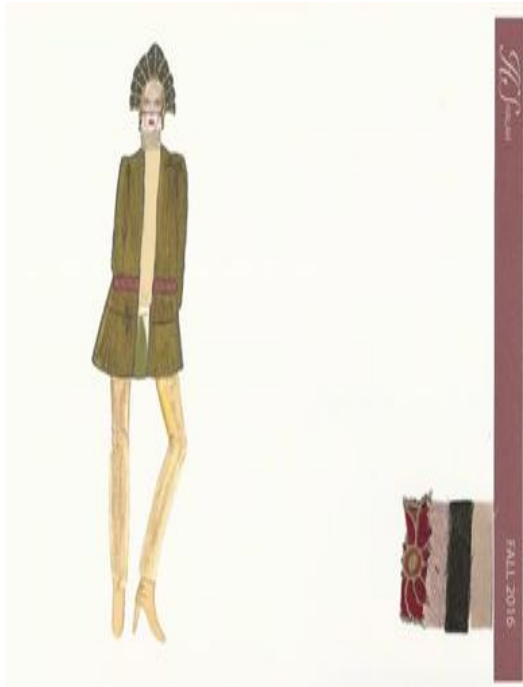
شكل (٢٠) تصميم حديث مستوحى من الطراز الروسي القديم عبارة عن كوت من الفرو الطبيعي مطعم بقطع من الدانتيل وبنطلون من الجلد الطبيعي وقميص داخلي من الحرير مع وجود عينات للأقمشة تصميم "رقم ١٣"