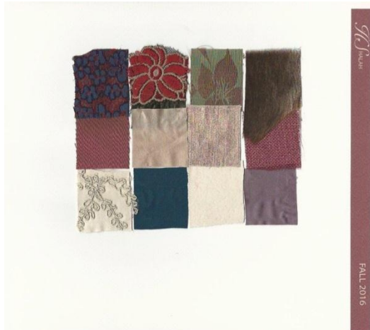
شكل (٣) عينات من الأقمشة المستخدمة في تنفيذ التصاميم

المبدع هو الذي يمتلك القدرة على اكتشاف كل ما هو جديد وتميز ليبدأ المراحل الأولى من التصميم وهي مرحلة التخطيط الذهني لأفكاره حيث ان كل ما يحيط بالمصمم من مؤثرات بصرية تدعوه الى التفكير والتأمل والتحليل في مصادر إلهامه ويكون ذلك نتيجة انعكاس خبراته البصرية او لأفكار مسبقة لديه من وحي الخبرات الثقافية والاجتماعية، وهناك عدة طرق يتبعها المصمم المبتكر لإيجاد طرق جديدة ومختلفة لحل بعض المشكلات التي تواجهه ومنها التفكير الحدسي والذي يستخدم في مراحل التصميم الأولى حيث يطلق خياله لإيجاد أفكار جديدة ومقبولة لدى المستهلك فقد يستخدم الرسم العشوائي لتطوير فكرة جديدة او أسلوب التشكيل بالقماش على المانيكان (١٣، ص٥٥)