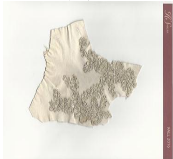
شكل (٦) عينة من التصميم مبتكرة بجمع خامتين مختلفة من الاقمشة والجلد مطرزة بحبات من الخرز