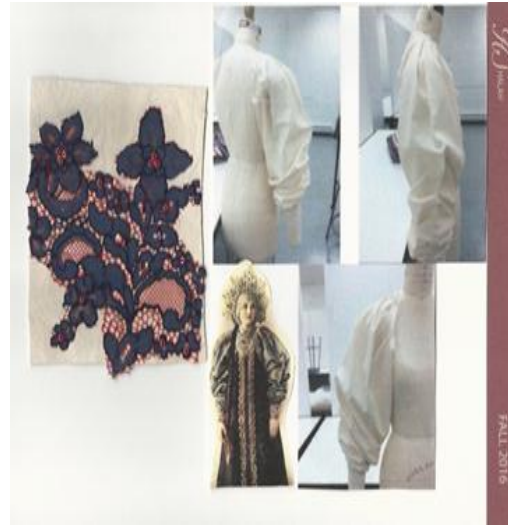
شكل (٥) تجارب أداء لموديل الاكمام المستوحاة من الزي الروسي القديم