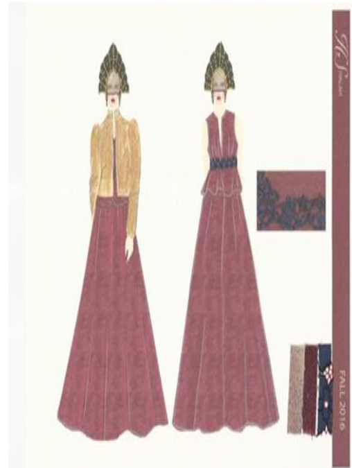
شكل (١٠) تصميم حديث مستوحى من الزي الروسي "السارافان" عبارة عن فستان من الدانتيل مطرز بالخرز وجاكيت من الجلد الطبيعي مع وجود عينات من الاقمشة. تصميم "رقم ٣،٢"