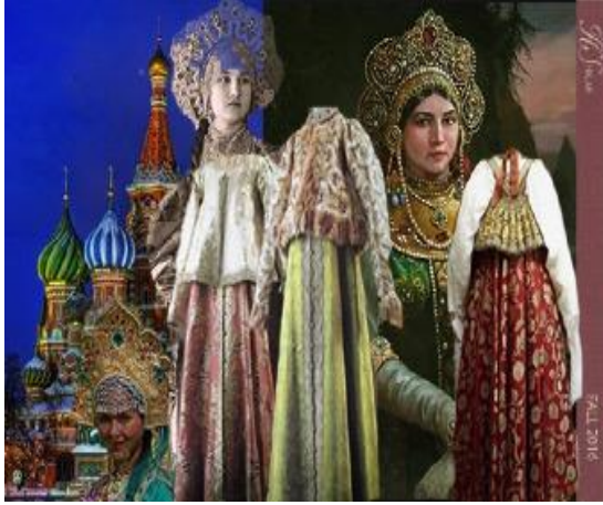
شكل (١) لوحة مصادر الالهام للتصاميم المستوحاة من الزي الروسي القديم والمباني الروسية القديمة صممت عن طريق برنامج Adobe Photoshop