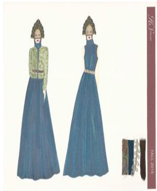
شكل (١٨) تصميم حديث مستوحى من الزي الروسي "السارافان" عبارة عن فستان من الحرير وجاكيت من قماش الجاكار والفرو الطبيعي وجود عينات من الأقمشة. تصميم "رقم ١٠،٩"