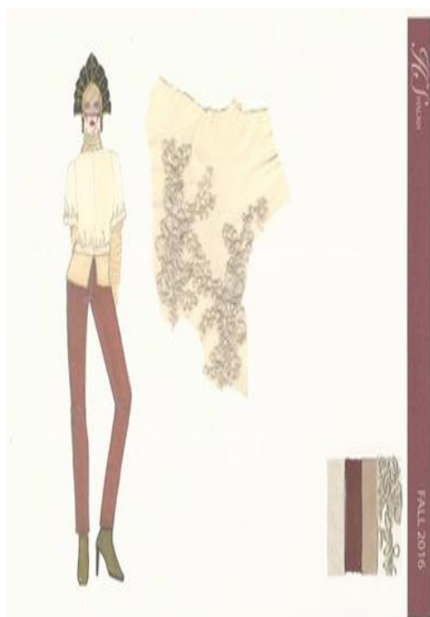
شكل (٢٢) تصميم حديث مستوحى من الطراز الروسي القديم عبارة عن جاكيت من الجلد الطبيعي مع عمل قطع من قماش الدانتيل ومطرز يدويا بالخرز وبنطلون وقميص داخلي وبنطلون من الحرير مع وجود عينات من الاقمشة. تصميم "رقم ١٤"