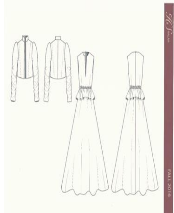
شكل (٩) شرح تفصيلي للموديل صمم عن طريق برنامج Adobe illustrator