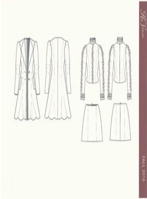
شكل (١١) شرح تفصيلي للموديل صمم عن طريق برنامج Adobe illustrator