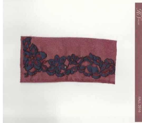
شكل (٤) عينة من التصميم مبتكرة بجمع خامتين مختلفة من الاقمشة مطرزة بحبات من الخرز