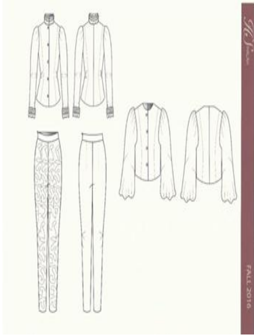
شكل (١٥) شرح تفصيلي للموديل صمم عن طريق برنامج Adobe illustrator