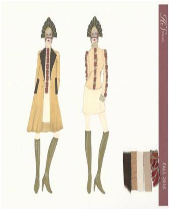
شكل (١٢) تصميم حديث مستوحى من الطراز الروسي القديم عبارة عن كوت له ياقة من الفرو الطبيعي وقميص حرير مطعم بالدانتيل وجونبلا من الجلد الطبيعي مع وجود عينات من الاقمشة.