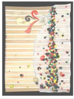
(التطبيق الثانى) شكل (١٠)