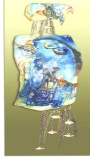
(التطبيق الثالث) شكل (١١)