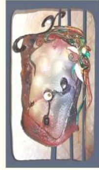
(التطبيق الرابع) شكل (١٢)