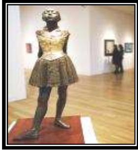
شكل رقم (٦)

لهيكل لجسم وألبس ديجا الفتاه حريراً حقيقياً ، وقطعاً من التل والشاش وشعراً مستعاراً، وعثر على التمثال .. وهو الوحيد الذى عرض خلال الفترة التى عاشها الفنان .. فى مرسوم ديجا بعد موته عام ١٩٧١ وكسى بالبرونز من ١٩٢٢ .