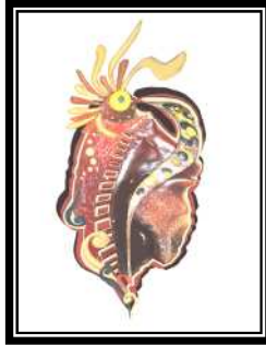
(التطبيق الأول) شكل رقم (٩)

المشغولة عبارة عن شكل مستطيلى تتداخل فيه الألوان الأبيض للشمع الألمانى والنبيتى لشمع العسل، ويمتد على جانب المشغولة الأيمن وإلى أعلاها تشكيل حر بلوائف من شرائح الجلد الطبيعى والصناعى، وفى المنتصف تظهر الشفافية بين الشموع فى تكسيرات عشوائية ليظهر اللون الغامق السفلى والمشغولة على خلفية من الشمع الأبيض الألمانى ومفرغة بخطوط طولية ومطبوع عليها ملمس مفرش بلاستيكى بتقنية الضغط.