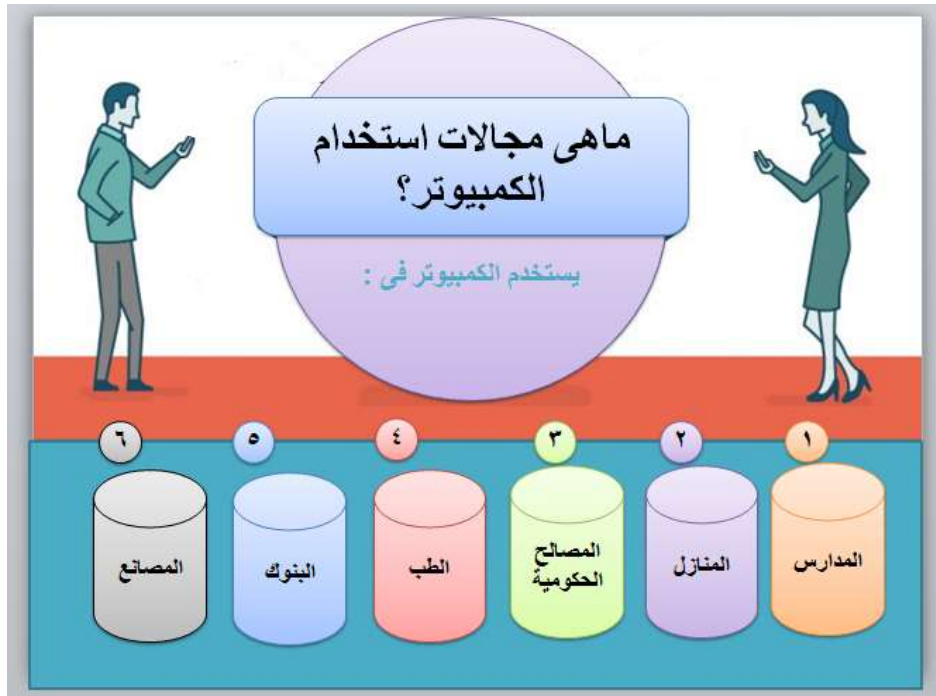
شكل (٣) يوضح الرسوم المعلوماتية الحوارية

استخدام بعض التلميحات البصرية في هذا النمط لجذب انتباه المتعلم، ومعلومات هذا النمط يتم تقديمها في تسلسل منطقي وغير مفاجيء للمتعم (Christopher, 2018). وعناصر هذا النمط هي: العنوان الرئيسي: وهو يشد انتباه المتعلمين، ومن خلاله يتم توصيل المعنى للمتعم دون الحاجة لقراءة باقي المكونات، ويعتبر ذلك هو الرسالة الرئيسة التي يريد المصمم توصيلها للمتعلمين، والعنصر الثاني: وهو عرض تفاصيل موضوع التعلم من خلال الشرح في نقاط رسومية جذابة، ويمكن عرض ذلك في صورة مشكلة تحتاج لحل، العنصر الثالث: عرض أهمية الموضوع من خلال عرض الرسوم المعلوماتية بطريقة يمكن فهمها