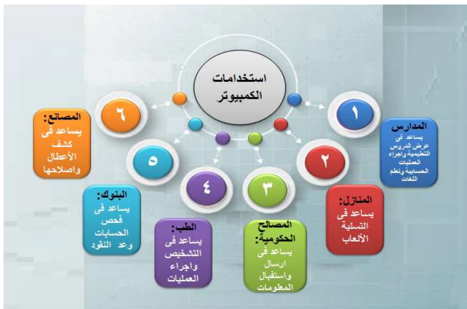
شكل (٢) يوضح الرسوم المعلوماتية الاستقصائية

بدون تفاصيل مفرطة، ويعطي ملخص ونصيحة للمتعلم في النهاية، وهو يقود المتعلم للتفكير في الوصول إلى النتيجة، ثم البحث عن مصدر دعم هذه النتيجة من خلال عنوانه الواضح الذي يعكس كل تفاصيل الموضوع بدون شرح، مثل استخدام رسم معلوماتي يوضح للطلاب أضرار التدخين دون شرح تفاصيل ذلك لتكوين اتجاهات سلبية لدى الموضوع المعالج (Randy, 2013). وتعد المفاهيم أو الأفكار المتضمنة التي تحتوي على مجموعة متنوعة من الموضوعات الفرعية المختلفة مناسبة بشكل مثالي لهذا النوع، وذلك لأنه يبسط المعلومات إلى أجزاء سهلة، كما أنها لديها القدرة على جذب انتباه المتعلمين، الأمر الذي يدفعهم إلى المشاركة والتفاعل مع المحتوى، واستخدام المخططات أو الرسوم البيانية البسيطة والملونة تعزز اتجاه الطلاب الإيجابي نحو موضوع التعلم، كما يمكن