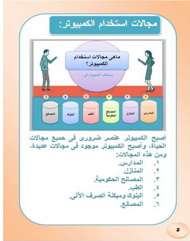
شكل (٥ج) يوضح تصميم الرسوم المعلوماتية الحوارية قبل النص في الكتاب الإلكتروني