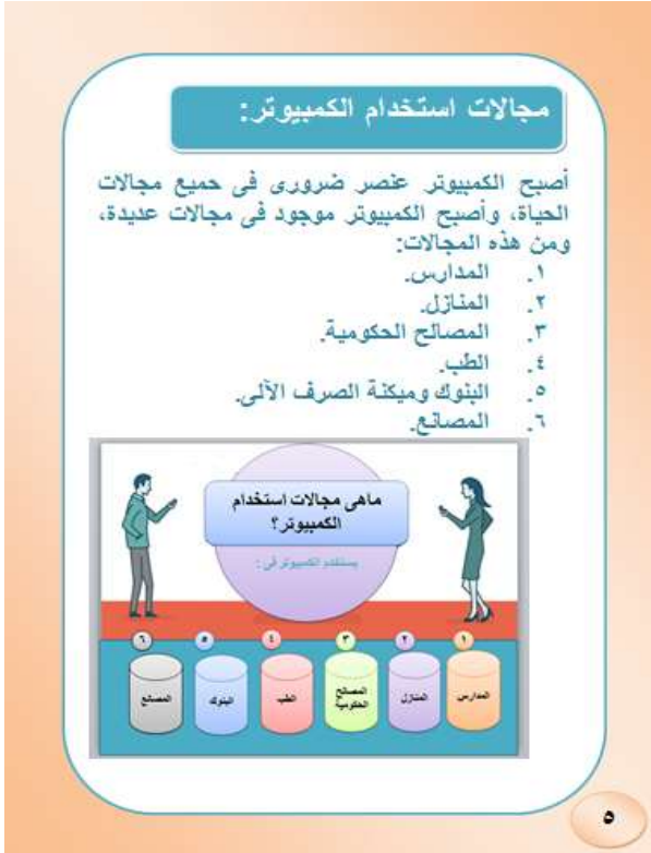
شكل (٥د) يوضح تصميم الرسوم المعلوماتية الحوارية بعد النص في الكتاب الإلكتروني