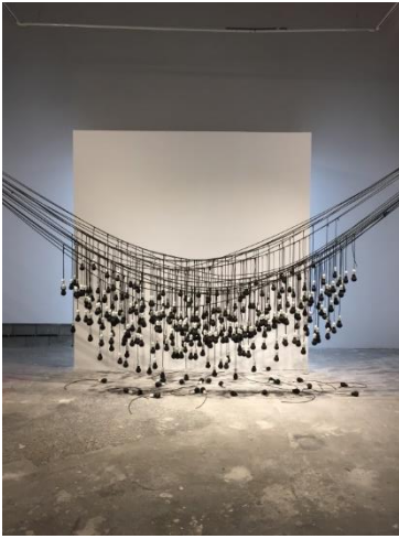
شكل (٨) الأنوار المعلقة سعيد قمحاوي، (الأنوار المعلقة) ٢٠١٩م، خشب محروق وأسلاك كهربائية، ٦x٤م، معرض ٢١،٣٩، جدة

صنع لنفسه بصمة خاصة تنمو معه في مراحل متنوعة تُكون في مجملها هويته التي تميزه عن غيره، وعادة ما يكون هناك إرتباط وإلتقاء بين مراحل الفنان بأن يبقى من المرحلة السابقة شيء من أثرها وتتهيئ للمراحل التي تليها