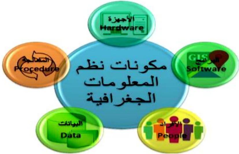
شكل (١) مكونات نظم المعلومات الجغرافية