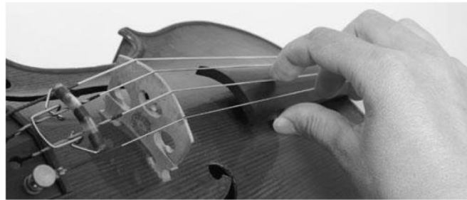
(شكل رقم ٢)