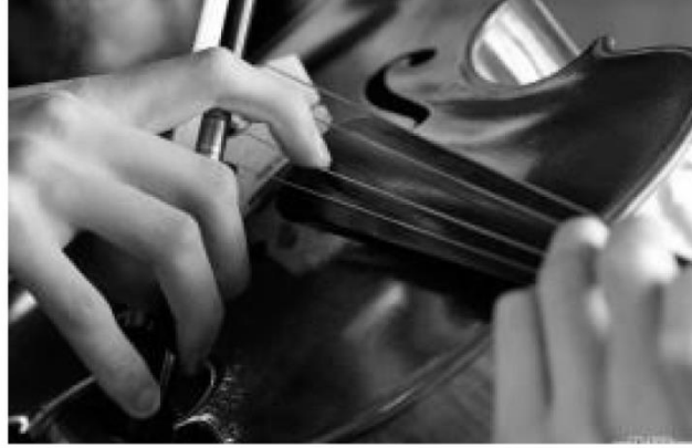
(شكل رقم ٣)