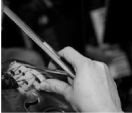
(شكل رقم ٤)

يوضح كيفية الإمساك بالقوس في حالة نبر الجمل الطويلة