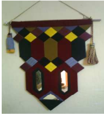
❖ مشغولة (٢) معلقة