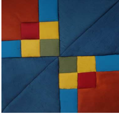
❖ مشغولة (١) تكاية

وفيما يلي عرض وتحليل للمشغولات المنفذه نتائج البحث