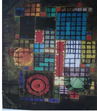
❖ شكل (٢) شباك من الزجاج. (١)

وصف العمل : يوضح تصميم لأحد الشبابيك التي قام جوزيف البيرز (yozef alperz) بتصميمها ويتضح من التصميم العصرية والابتكار واحتوائه على الشفافيات والأشكال الهندسية والخطوط الهندسية وعلى البساطة والاتزان .