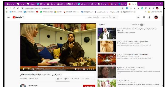
شكل [3] يوضح لقطة لشاشة منصة اليوتيوب أثناء عرض أحد المقابلات الفنية، المتاحة من خلال الرابط: (https://www.youtube.com/watch?v=gmlzmFCzv_4&t=330s).

وقد قام الباحث بفرز وتصنيف كل مشروع (ريويرتاج/ لقاء فنى) بشكل منفصل وتجهيزه لمناقشة الطلاب فيه، للوقوف على مدى استفادة كل طالب فى كل مجموعة على حدة من هذه التجربة وهذا التطبيق، للتعرف على مدى استفادة الطلاب من الإمكانيات المستحدثة لوسائل الإعلام فى انتشار الفن التشكلى، من خلال عملية الاتصال المباشر والمتبادل بين المتلقى والفنان، وكذلك اختبار صحة الفروض. وفيما يلى عرض وتحليل لعدد من التطبيقات الفنية التى قام بتنفيذها عدد من المجموعات الطلابية (عينه البحث)، وهذه التطبيقات تمثل نماذج من اللقاءات الفنية المصوّرة مع عدد من أساتذة هؤلاء الطلاب فى الكلية، والذين هم يمثلون أيضاً جزء من حركة الفن التشكلى المصرى المعاصرين؛ على سبيل المثال - أجدياً - فى مجال التصوير، الفنانين: حسام صقر، سلمى العشرى، عادل ثروت، عماد أبو زيد، محمد المسلمانى، نادية وهدان، وائل درويش، وفى مجال النحت، الفنانين: حسن كامل، عصام درويش. وفى مجال الخزف، الفنانين: أشرف كمال، أمانى فوزى، سمير حسين. بالإضافة إلى لقاءات مع عدد من فناني صالون الشباب فى دورته الثلاثين 2019، الذى تزامن مع قيام الطلاب بالتطبيق العملى للبحث. كما تضمنت هذه التطبيقات عدد من الريويرتاجات