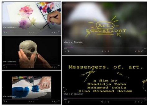
شكل [8] يوضح تقرير تعريفى مصور عن كلية التربية الفنية.

وشكل [8] فيوضح عدد من اللقطات من فيديو يتضمن ريبورتاج (reportage) بعنوان: ماهى التربية الفنية؟ (What is art education?)؛ وهو عبارة عن فيديو تعريفى – تثقيفى -عن كلية التربية الفنية ومجالات الدراسة بها: (التصميم - التصوير - الخزف - النحت - المعادن - الاشغال الفنية: النجاره، النسيج، الطباعة – النقد والتذوق الفني – علوم التربية الفنية)، وكذلك مجالات العمل المتعددة والمتاحة للخريج بفضل الخبرات التي يكتسبها