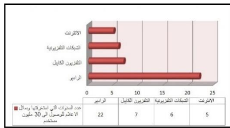
شكل [2]: يوضح عدد السنوات التي استغرقتها وسائل الاعلام للوصول الى 30 مليون مستخدم. Diffusion of innovations theory, https://www.researchgate.net .

إن نظرية انتشار المبتكرات تنطبق تماماً على ما يُطرح على شبكة الإنترنت وبالأحرى منصات التواصل الاجتماعي، خصوصاً خلال هذه المرحلة التي انتشر فيها فيروس كورونا (كوفيد 19)،