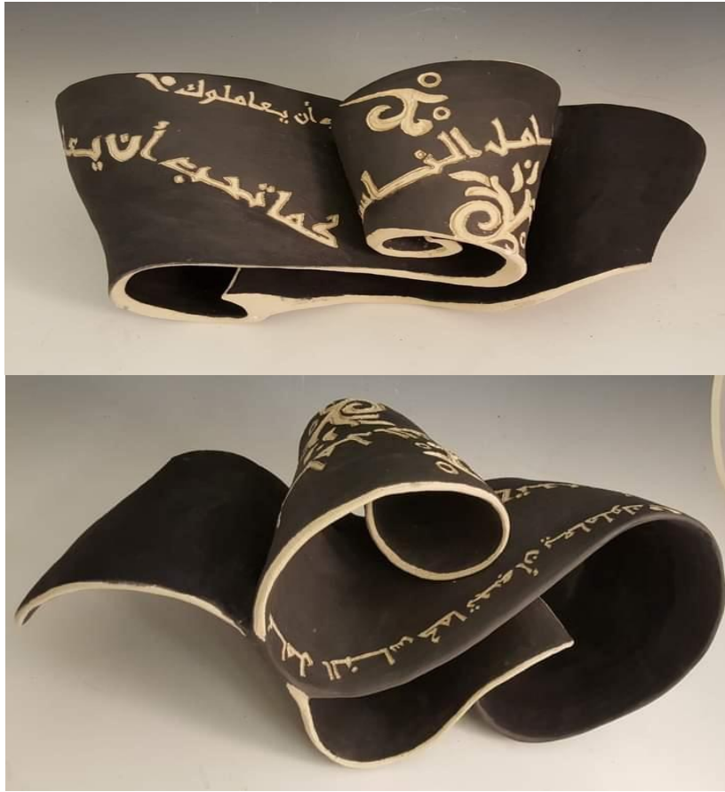
شكل (١٠) الخزافة هدي هاوسوي، ٤٦ × ٥٦ سم إنتاج ٢٠١٥