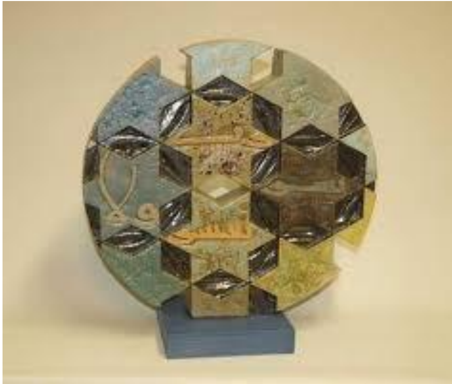
شكل (١٤) الفنان وسام حداد - بينالي أندنه لفن الخزف بلجيكا - ٢٠١٢