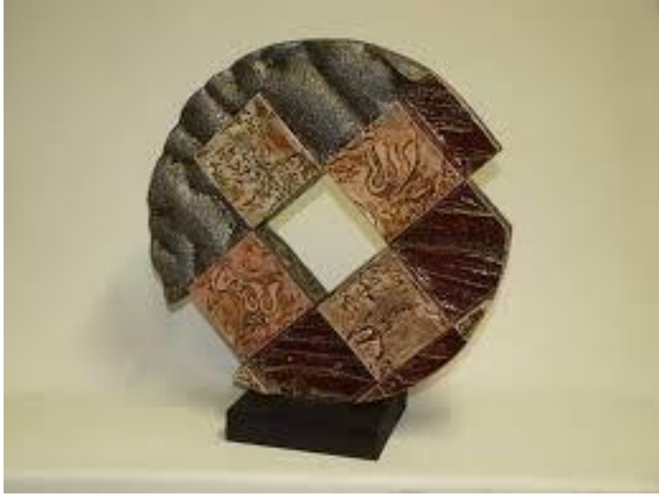
شكل (١٣) الفنان وسام حداد - بينالي أندنه لفن الخزف بلجيكا - ٢٠١٢