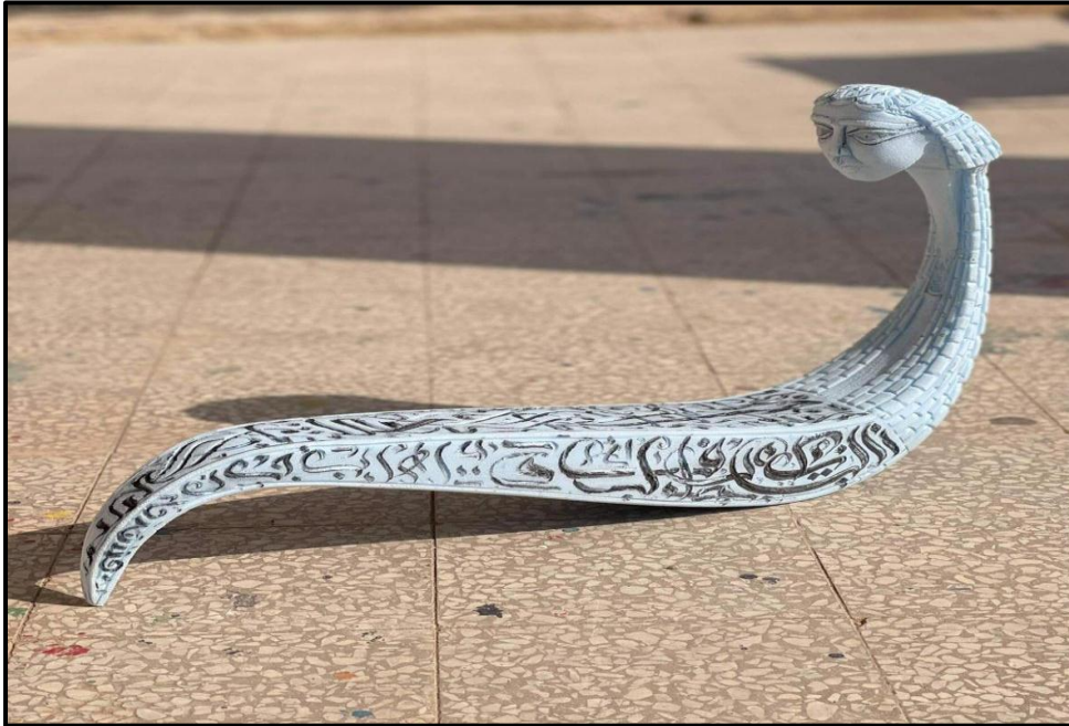
شكل (١٦) حرف الراء - الابعاد ٥٠*٧٠*١٠سم - polyurethane البولي