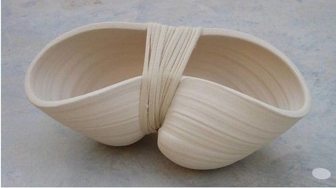
شكل ٩

يظهر في الشكل الاسطواني اعتماد الفنان عل الملمس واللون وحد الرضية الشكل الخزفي باللون الابيض مع اضافة تجهير الثقوب والفتحات المنتظمة علي جدار الشريحة الخزفية بشكل هندسي واضح، تجهيزا للمكمل الذي ياتي دورة فيما بعد عملية الحريق، حيث حاك الخيوط اللونية بعد ذلك مستخدما الفتحات سابقة التجهيز علي جدار الشكل الاسطواني في تناغم لوني واضح اثري سطح الشريحة مما يوضح مدي قوة تأثير المكمل عل الشكل الخزفي.(شكل ١٠)