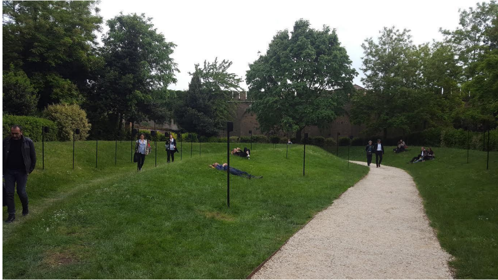
(شكل رقم-٧) حسن خان، مقطوعة لحديقة عامة، بينالي فينيسيا الدولي، ٢٠١٧

وحول رؤيته المستقبلية لفن "الفيديو ارت"، قال خان: "عامّة أنا لا أوّمن بالتصنيفات والعناوين لأفرع الفن، فالعمل الفني، على الأقل في رؤيتي يمكنه أن يكون في أي وسيط، ويمكننا حتى أن نخترع وسيط لعمل واحد لمرة واحدة ثم نتخلص منه، فقيمة العمل لا تأتي من الوسيط ولكن من العمل ذاته، كما أن المحتوى هو الذي يتطلب وسيط، بعينه (١) .