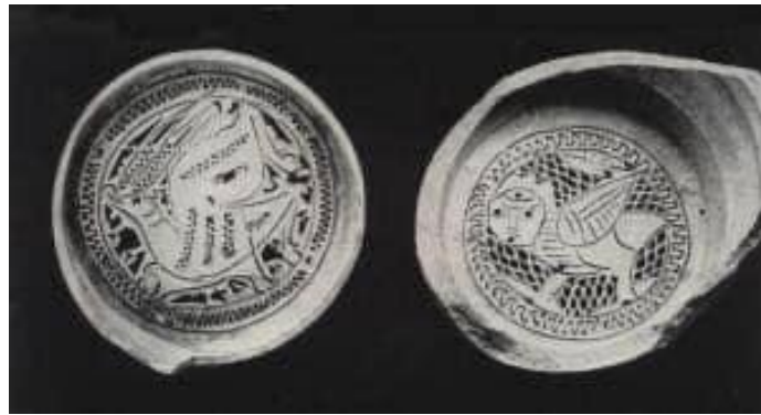
(شكل رقم-٦) نماذج من شبايك القلل من الفن الإسلامي العصر الفاطمي - المتحف الإسلامي - القاهرة