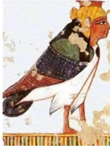
(شكل رقم ١) الببا على شكل النسر حورس بوجه آدمي

وفي الفن الإسلامي نري في "شبابيك القل" مثال واضح لفكرة ومفهوم الفن اللامرئي، حيث قام الفنان في ابداع رسوم وزخارف ببراعة تقنية في الجزء الفاصل بين "رقبة" القلة والبدن وهي منطقة مخصصة لعمل حاجز لتنظيم تدفق الماء اثناء الشرب، وكذلك للحماية من الحشرات