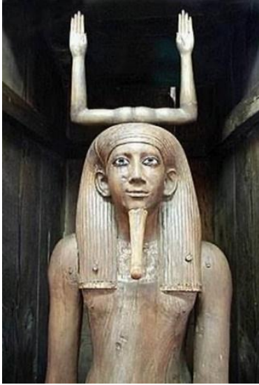
(شكل رقم ٢) الكا اعلي الراس علي شكل يدين متصلتين وتتجهان للأعلى

"ألبا " والكا " عند قدماء المصريين حيث اعتقد المصري القديم في أن الإنسان يتكون من حياتين كائن مرئي وهو الجسد ويرمز له بشكل طائر له رأس آدمي وتسمى " الببا " شكل (١) والروح ويرمز لها بذراعين متصلين يتجهان للأعلى " شكل (٢) وأصبح يتعامل مع الجسد المرئي كرمز يوضع على توابيت الموتى وتوضع الكا وهو رمز الروح أعلى رأس الميت لاعتقاده أنها القرينة للإنسان (٢)