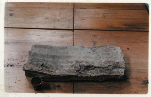
(شكل رقم-٧) اعمال لفنان سونج دونج في الكتابة بالماء علي الحجر

Song Dong, Water Diary , 1995, color photograph, 40 cm x 60 cm (15-3/4" x 23-5/8") each, 4 pieces