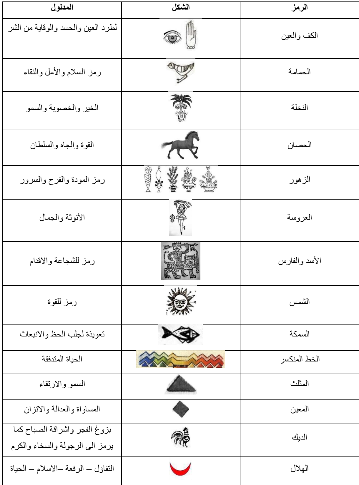
جدول الرموز الشعبية ومدلولاتها

وفق طريقته الذاتية من خلال مجموعة من المعالجات التشكيلية من تجريد واختزال وتركيب وتكرار ليكون في النهاية صياغة رمزية جديدة خاصة بالفنان، قد تساعدنا في استحداث صياغات ودلالات معاصرة .