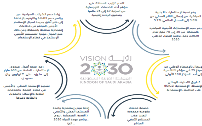
أهم أهداف رؤية المملكة ٢٠٣٠ الخاصة بجذب الاستثمارات الأجنبية المباشرة