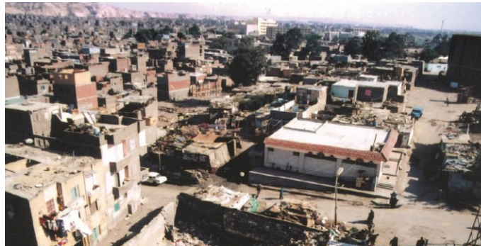
شكل ١، منطقة مساكن زينهم قبل التطوير