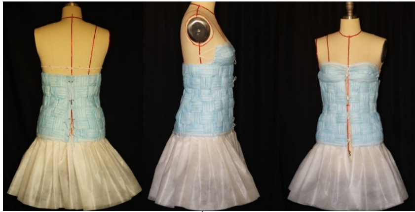
صورة 9 والتصميم من الأمام والجنب والخلف

المتقاطعة، أما الجزء السفلي فتظهر خطوط الكسرات المستقيمة ذات الشكل الأشعاعي، وترتبط أجزاء التصميم من حيث الخامات حيث استخدمت خامات غير منسوجة لجميع أجزاء التصميم، ويحقق التصميم الاتزان المتمثل حيث يتطابق الجزء الأيمن بالجزء الأيسر للتصميم.