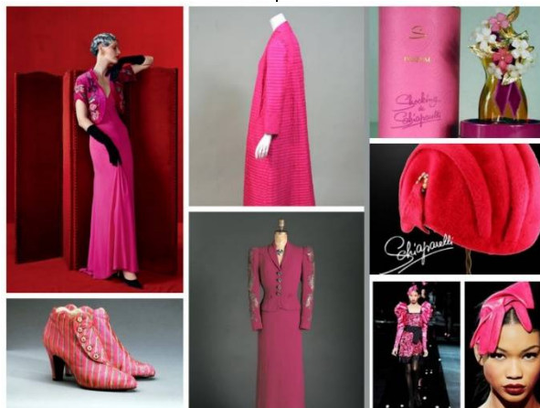
صورة 1 المصممة الإيطالية إلسا شياپاريلي (Elsa Schiaparelli) 1930 م