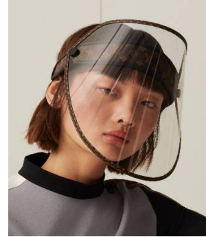
صورة 4 عارضة ترتدي درع واقى للوجه من الفايرروس ووقاية من الشمس بيت أزياء (Louis Vuitton)

https://designinquarantine.com/359-LV-Shield