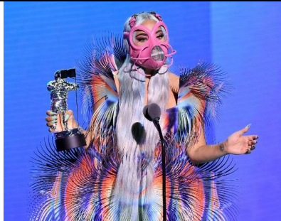
صورة 7 المغنية ليدي غاغا ترتدي قناع وردي من خامة الجلد https://www.vogue.it/news/article/mtv-vma-2020-tutti-i-vincitori-lady-gaga-ariana-grande Access (1-10-2020)