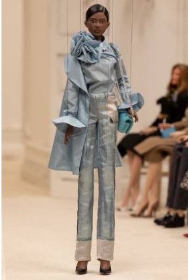
صورة 2 من بيت أزياء موسكينو (Moschino) لربيع وصيف 2021

وفي موسم يتسم بوضوح بالأفكار الرائعة والخروج عن الأفكار العادية، ابتكر جيرمي سكوت (Jeremy Scott) من بيت أزياء موسكينو (Moschino) لربيع وصيف 2021م الدمى المتحركة من عارضات الأزياء المفضلة لارتداء 40 مظهرًا ، والتي تم تصنيعها أولاً في إصدارات بالحجم الطبيعي ومن ثم تصغيرها لتناسب الدمى مقاس 30 بوصة (Madsen, 2020)، وذلك تلافياً لوجود تجمع في عرض الأزياء بسبب الأحداث الراهنة صورة (2).