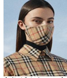
صورة 3 عارضة ترتدي كمامة قماشية من بيت أزياء

وصممت دار الأزياء الفرنسية لويس فيتون (Louis Vuitton) درعا واقياً للوجه لفيروس كورونا يتميز بنقوش حروف LV مميزة، والذي يمكن أيضاً قلبه واستخدامه كواقى من الشمس حيث صنع من مادة ضوئية حساسة للضوء ، فهو يغمق استجابة لأشعة الشمس المباشرة، ويتحول من شفاف إلى ملون لحماية مرتديه من وهج الشمس الخفيف صورة(4) (Hitti, 2020)، وأديداس (Adidas) والتي أطلقت قناع وجه قابل لإعادة الاستخدام صورة(5) (Ravenscroft, 2020).