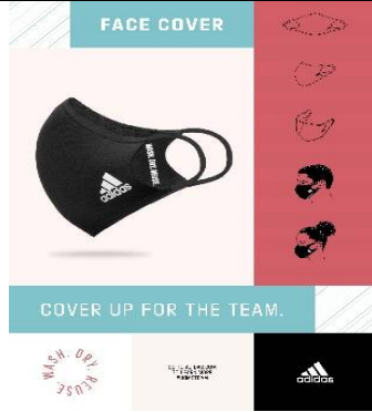
صورة 5 قناع الوجه من اديداس

https://www.vogue.it/moda/article/mascherine-lavabili-cotone-firmate-moda-burberry Access