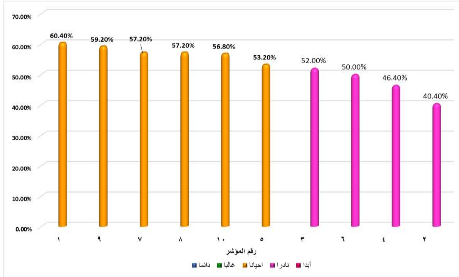
شكل (3) ترتيب مؤشرات معيار (مؤهلات أعضاء هيئة التدريس والأداء والنمو المهني لهم) وفقا لأوزانها النسبية