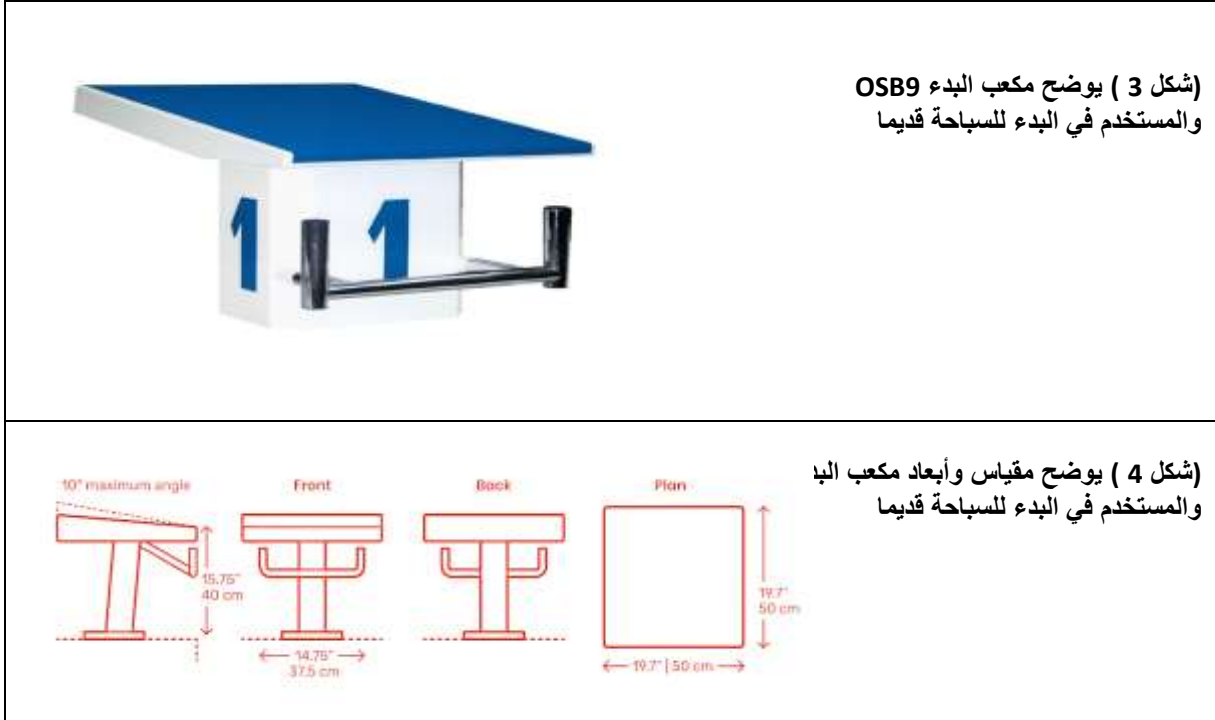
(شكل 3 ) يوضح مكعب البدء OSB9 والمستخدم في البدء للسباحة قديما