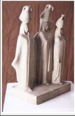
تمثال العودة من النهر