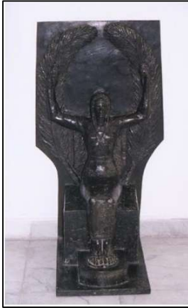
تمثال وجه بحري