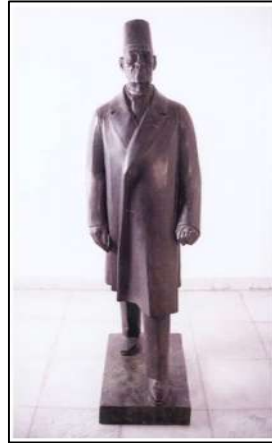
تمثال سعد زغلول