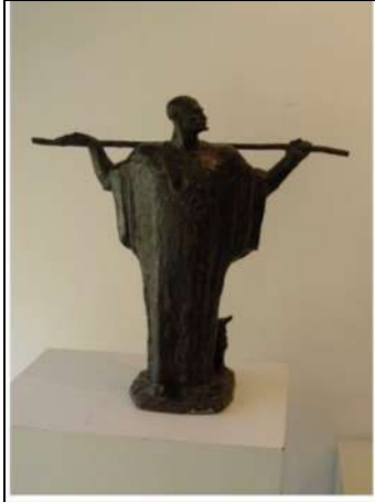
تمثال حارس الحقول