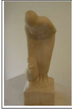
تمثال على شاطئ الترعة