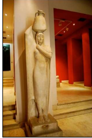
تمثال حاملة الجرة