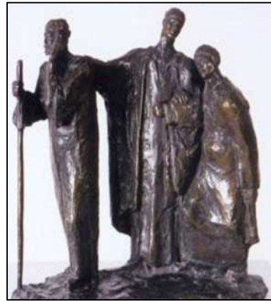
تمثال العميان الثلاثة