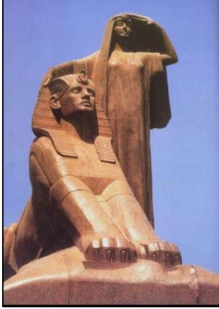
تمثال نهضة مصر

تمثال نهضة مصر عام ١٩٢٠، ابن البلد، الحزن، بنت الشلال، شيخ البلد، سعد زغلول، حارس الحقول، حاملات الجرار الفلاحة، نهر النيل، رياح الخماسية.