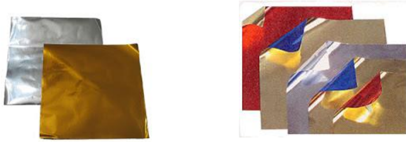
صورة رقم (٥)