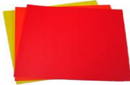
الصورة رقم (٤)

ويوجد منه جميع الألوان ، ويكون أحد وجهى الورقة بالأبيض والوجه الآخر بلون مختلف ، وهو من أرخص أنواع ورق الأوريجامى ، ويتميز هذا الورق بكونه أرق حجماً من الورق العادى كما بالصورة رقم (٤) .