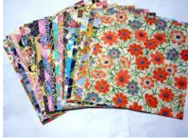
صورة رقم (٣)

ورق يابانى يتميز بكونه أكثر ليونه من الورق العادى ،ويصنع الواشى يدوياً من ألياف اشجار البامبو والقمح ، وكان هذاالنوع من الورق يصنع يدوياً فى الماضى أما الآن فهناك محلات متخصصة فى بيع هذا النوع من الورق . ويعد هذا النوع من أغلى أنواع الورق ونظراً لغلو سعره فإنه لا يستخدم على نطاق واسع فى فن الأوريجامى كما بالصورة (٣). (chow tszho- 2011)