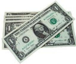
صورة رقم (٧)

ومن الأقمشة المستخدمة في فن الأوريجامي :-