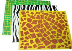
صورة رقم (٦)