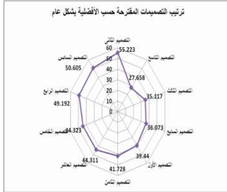
شكل رقم ( ١٣ ) ترتيب التصميمات حسب مناسبتها للمرحلة العمرية

ويرجع ذلك الى ان التصميم الثاني مسائراً لخطوط الموضة من حيث اللون والتصميم ومناسبته للفئة العمرية ، فضلا عن التوظيف الامثل للمكمل في اثناء الجانب الوظيفي بإبراز التصميم بأكثر من هئية متنوعة وإثرائه للجانب الجمالي حيث اعطى المكمل تأثير التطريز اللامع مما جعله مناسباً جدا لملابس السهرة ، بينما جاء التصميم التاسع في الترتيب الاخير نظرا لنمطية التصميم في هيئتيه ونمطية وتوزيع المكمل .