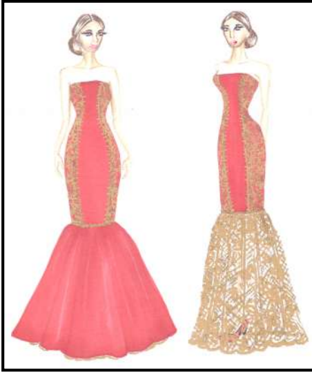
شكل رقم (١) يوضح التصميم الأول

فستان سهرة طويل من خامة الدانتيل والتفتاه بقصة برنسيس من الامام والخلف مزينة بسحاب معدني ذهبي على طول القصة ،و بكورنيش يبدأ من خط الركبة من طبقتين الداخلية الدانتيل والخارجية من التفتاه محلى ومثبت بالفستان عن طريق سحاب يمكن من خلاله ازالة طبقة التفتاه العلوية .