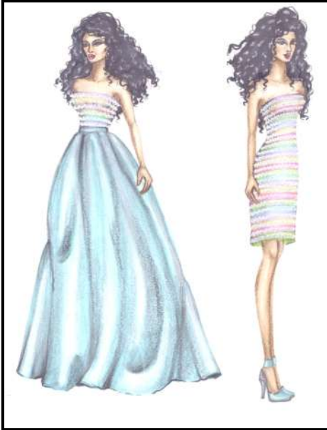
شكل رقم (٥) يوضح التصميم الخامس

فستان قصير من النقته السماوي مزين بكاملة بسحبات معدنية لامعة متعددة الالوان يضاف له ذيل متسع يمكن تركيبه وفصله عن طريق سحاب عند خط الوسط