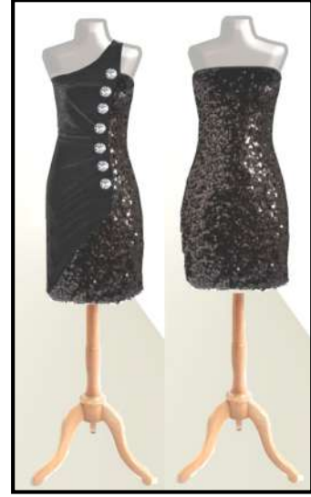
صورة رقم ( ٣ ) تنفيذ التصميم الثامن