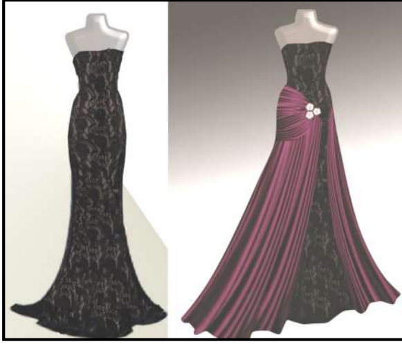
صورة رقم ( ٤ ) تنفيذ التصميم العاشر