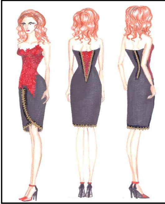
شكل رقم (٣) يوضح التصميم الثالث

فستان سهرة طويل من خامة التفتاه الذهبي الفاتح استخدمت المشابك المعدنية في الامام بلونها الفضي والذهبي متعدد درجات اللونية في تزيين الصدر بكثافة متدرجة تقل كلما اتجهنا لخط الوسط، بينما استخدمت في الخلف في تزيين خط الوسط كحزام وأيضا في تثبيت ذيل للفستان يمكن تركيبه وفصله من خلالها