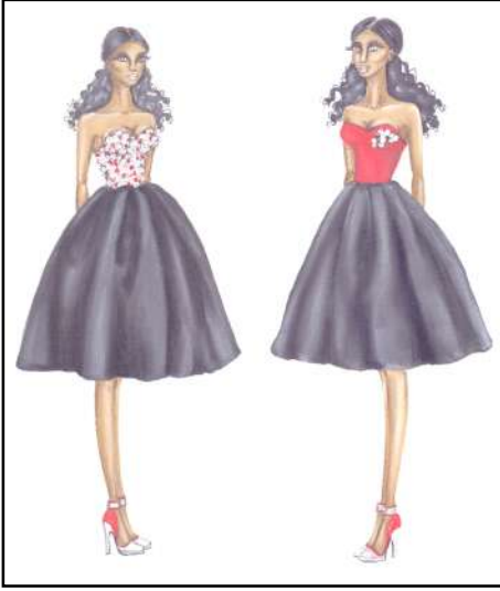
شكل رقم (٦) يوضح التصميم السادس