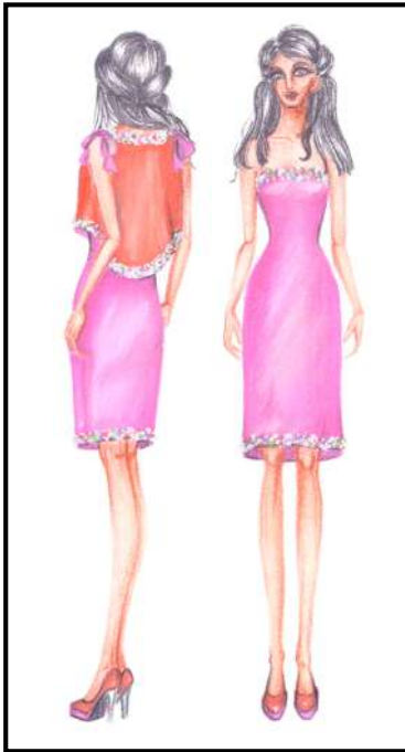
شكل رقم (٨) يوضح التصميم الثامن

فستان سهرة قصير من خامة الترتز الأسود الامع علية قصة كروازيه بدرابيه متشع من قماش التفتاه المطفي يثبت محلى من الكرف بازالاير من خامة الترتر أيضا ، والتي من خلالها يتم تثبيت أو فصل الكروازيه.