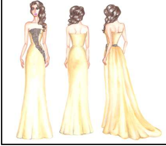
شكل رقم (٢) يوضح التصميم الثاني