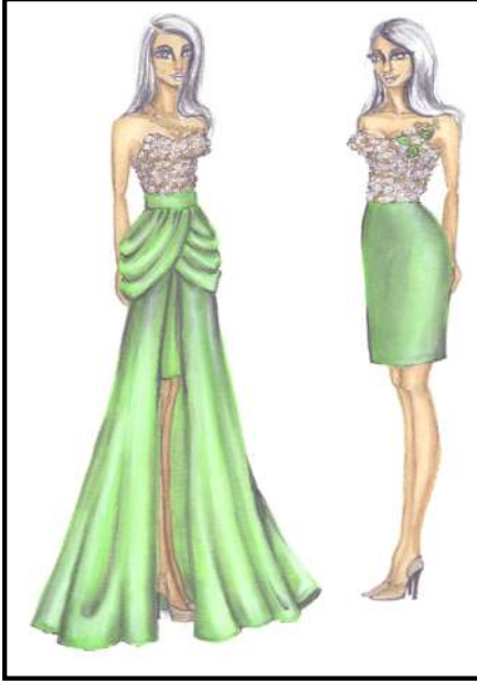
شكل رقم (٤) يوضح التصميم الرابع

فستان سهرة قصير من الساتان الاخضر مزين فيه الصدر بالكباسين الفضية والذهبية بدرجات لونية مختلفة ، مثبت به من أسفل طبقة علوية من الحرير يأخذ من عند خط الوسط درابيهات حرة ناعمة مثبت بالفستان من خلال كباسين داخلية مثبتة في الحزام ، ويمكن تركيب الجزء السفلي للفستان أو ازالته عن طريقها.