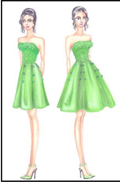
شكل رقم (٧) يوضح التصميم السابع

فستان قصير من التفتاه الصدر محلي ببيبة تم تحضيرة ليشبه العروة من نفس اللون وخامة الفستان تم تنظيمه ليعطي شكل قشور السمك ، والذيل عبارة عن كلونات موزعة على كامل خط الوسط بمسافات متساوية، يمكن اغلاق الكالونات حتى خط الجنب عن طريق عراوي من نفس بيبه الصدر من جهة والأخرى أزرير ويمكن تركها مفتوحة لتعطر للفستان مظهر أحر أكثر اتساعاً.