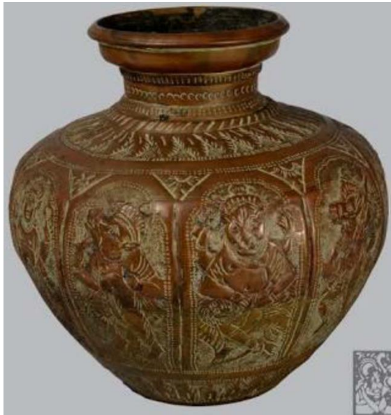
لوحة (٩) توضح شكل من الاشكال المختلفة للاناء

تحمل زخارف نباتية وهندسية والاله المعبوات الهندية القديمة على الاواني المقدسة (سفينة الأضحية) فى العصر المغولى الهندى (٩٣٢ / ١٢٧٤ هـ - ١٥٢٦ / ١٨٥٨ م)