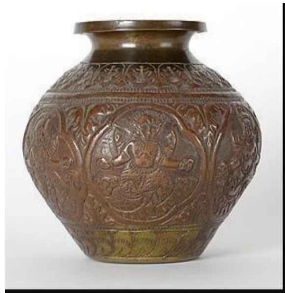
( ٧ )

تحمل زخارف نباتية وهندسية والاله المعبوات الهندية القديمة على الاواني المقدسة (سفينة الأضحية) فى العصر المغولى الهندى (٩٣٢ / ١٢٧٤ هـ - ١٥٢٦ / ١٨٥٨ م)