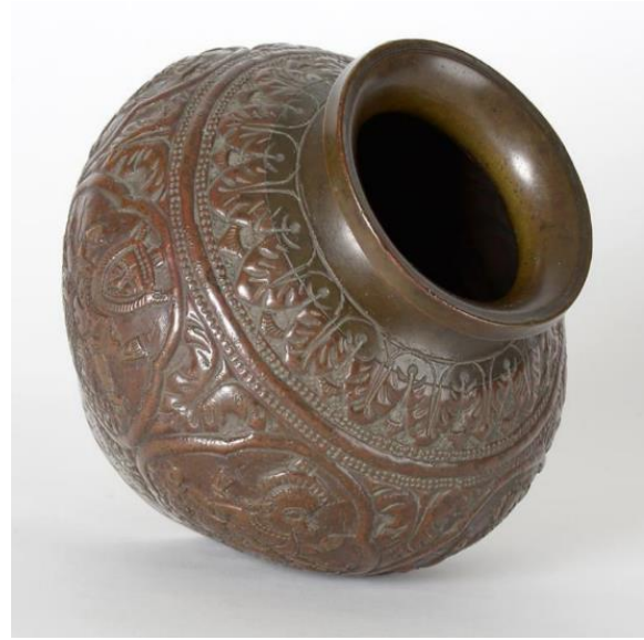
لوحة ( ٦ ) توضح رقبة الاناء والزخارف النباتية الذى يحمله