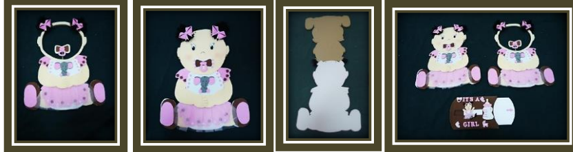
مجموعة المشغولات رقم (14)