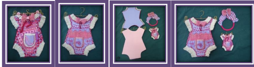
مجموعة المشغولات رقم (15)