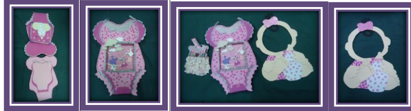
مجموعة المشغولات رقم (18)