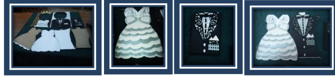
مجموعة المشغولات رقم (1)