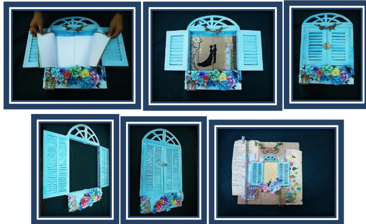
مجموعة المشغولات رقم (5)