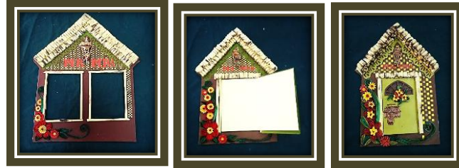
مجموعة المشغولات رقم (4)