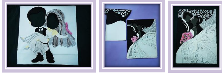
مجموعة المشغولات رقم (8)