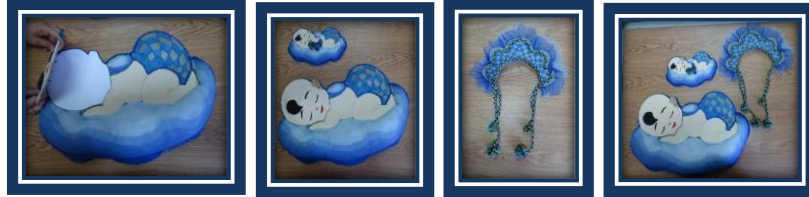
مجموعة المشغولات رقم (16)