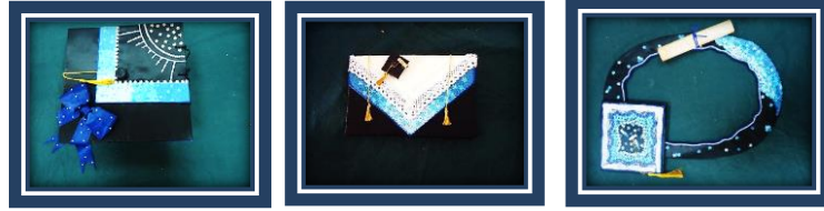
مجموعة المشغولات رقم (23)