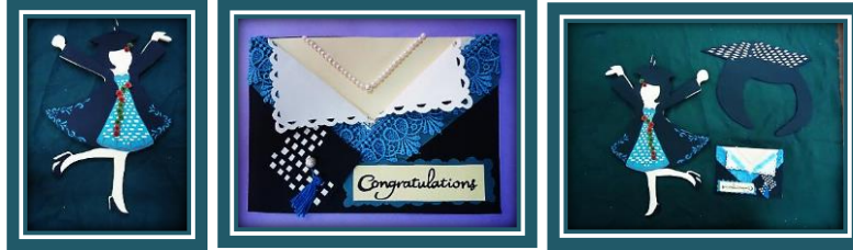
مجموعة المشغولات رقم (24)