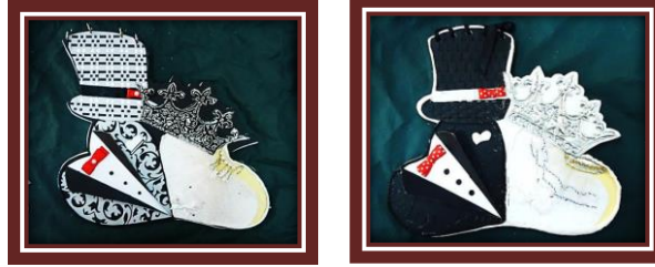
مجموعة المشغولات رقم (7)