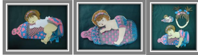
مجموعة المشغولات رقم (19)