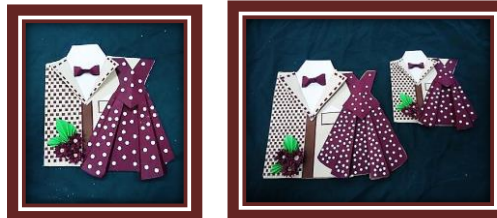
مجموعة المشغولات رقم (11)