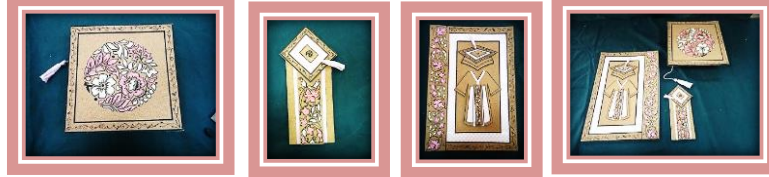
مجموعة المشغولات رقم (21)