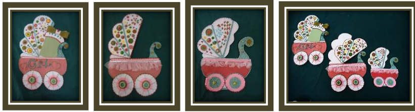
مجموعة المشغولات رقم (13)