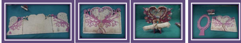
مجموعة المشغولات رقم (3)