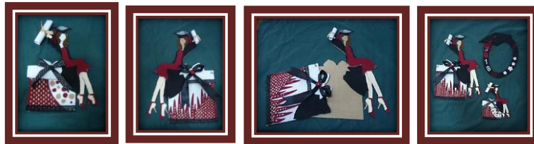
مجموعة المشغولات رقم (25)