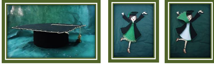
مجموعة المشغولات رقم (20)