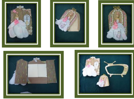
مجموعة المشغولات رقم (2)