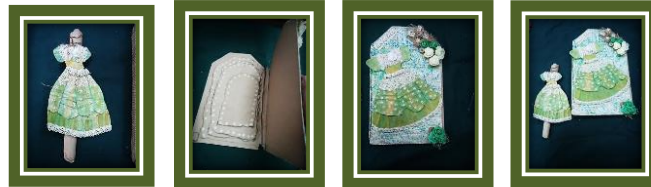
مجموعة المشغولات رقم (10)