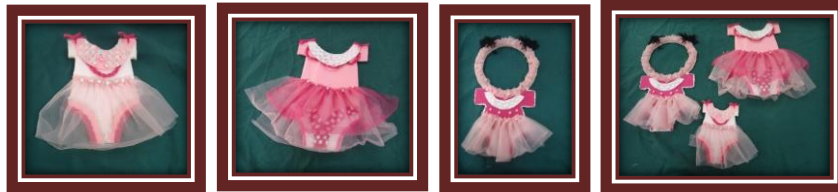
مجموعة المشغولات رقم (17)