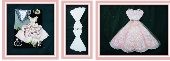
مجموعة المشغولات رقم (6)