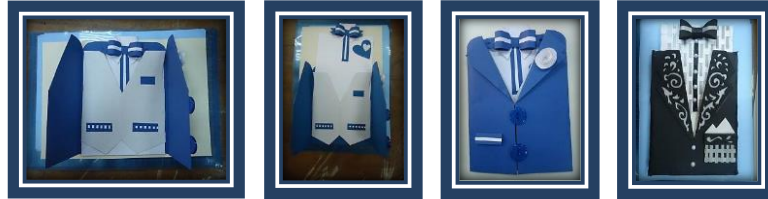
مجموعة المشغولات رقم (9)