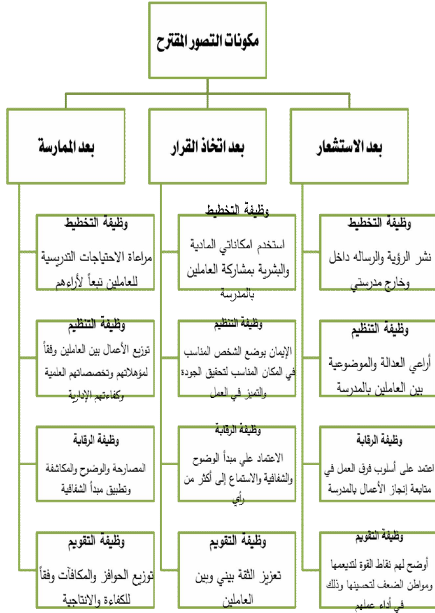
شكل (٢) مكونات التصور المقترح

يتضح من الشكل السابق في بعد الاستشعار ما يلي: