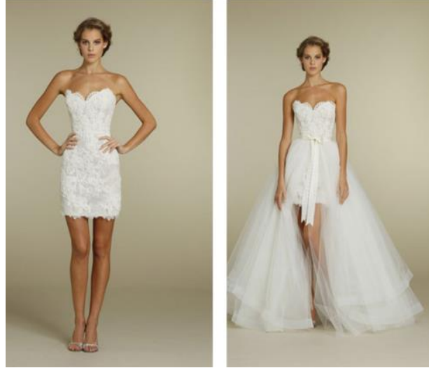
صورة رقم (3)