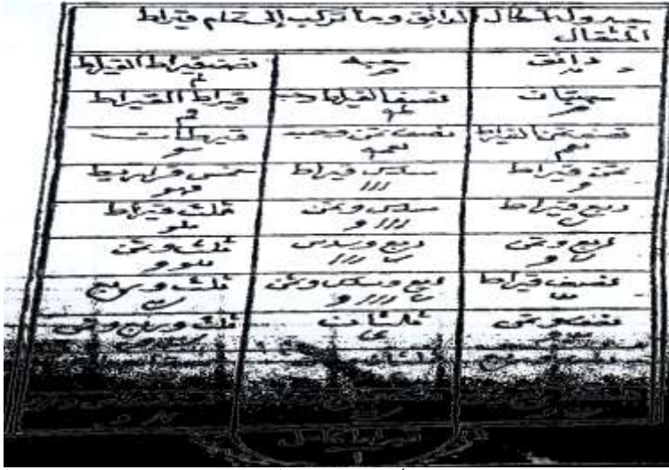
شكل ( جداول يوضح الدائق والقيراط وأجزائه عن: الذهبي: تحرير الدرهم، نشر الكرملية: النقود العينية، ص ١٠ .