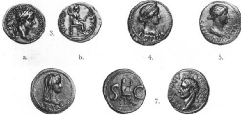
شكل رقم (١٢)

Roller, Lynn E., (1999). "Attis on Greek Votive Monuments; pp. 225–227.