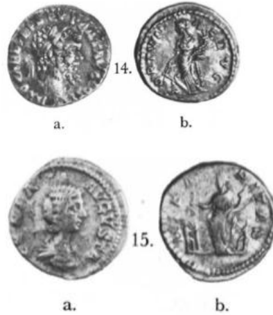
شكل رقم (١٤)

Brit. Mus. Cat. of Roman Coins (BMC) IV, Antonines, p. 232, no. 1437 Sydenham, Roman Republic, p. 127, no. 777, pi. 22 (Volteius, obv. bust of Attis or Mars), and p. 188, no. 1155