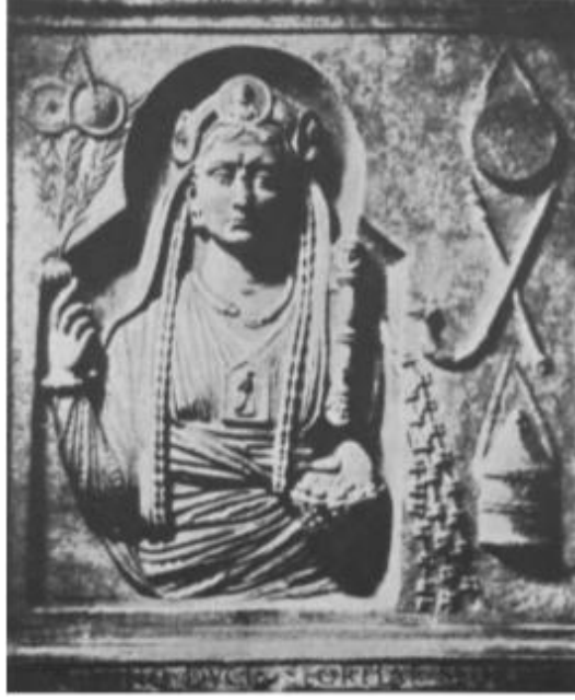
شكل رقم (٣)

كاهن من كهنة كيبيلي بمتحف الكابيتول (غير معروف اسمه)