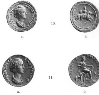
شكل رقم (١٣)

مجموعة عملات تمثل كيبيلي فوق عربتها وبجوارها الأسود من العصر الجمهوري