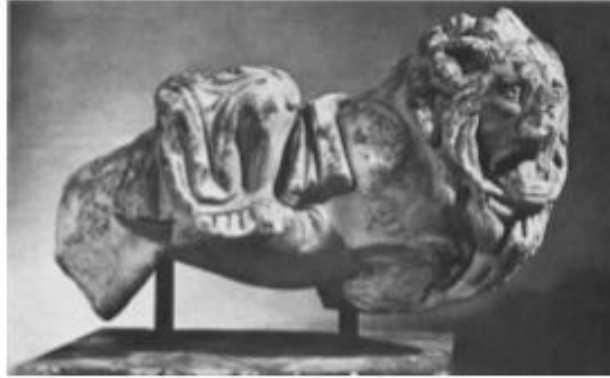
شكل رقم (٩)