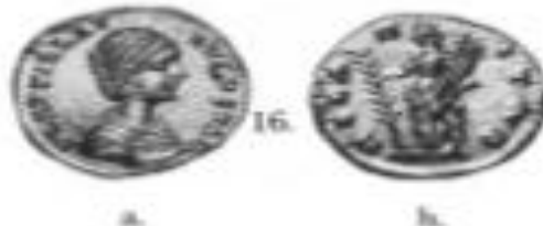
شكل رقم (١٥)