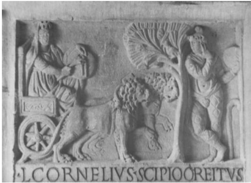
شكل رقم (٨)