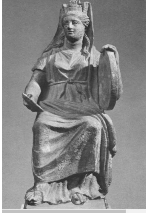
شكل رقم (٤)

Spinazzola, Scavi nuovi, p. 230, fig. 219.