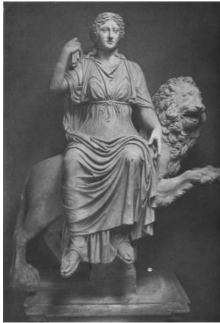
شكل رقم (١٠)

Musee des Beaux-Arts.