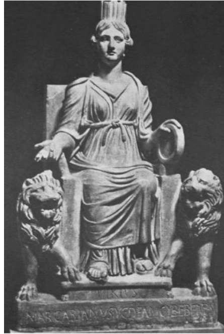
شكل رقم (٦)

Guimet, 2006-2007, éditions de la Réunion des musées nationaux, Paris, p. 300.