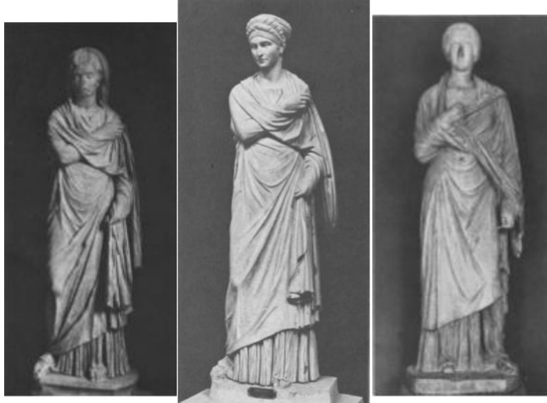
شكل رقم (١١)