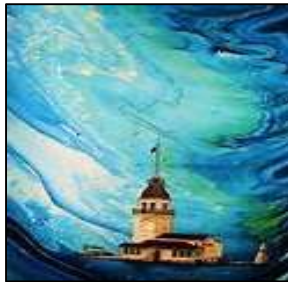
شكل (٨) يورخ احدي معالم المعمار التاريخي التركي المرسومه علي أرضيه وخلفيه تمت معالجتها بتقنيه الابورات.