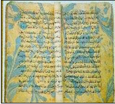
شكل (٢) يبرز استخدام الابرورات في تزيين أوراق الكتابه .

ومما سبق وجدت الباحثة ان فن الابرور ملئ بالقيم الجماليه والتشكيليه التي تحمل في طياتها عبق التراث التركي الاسلامي الاصيل بما يحمله من ثقافات فنيه تتباين وفق الحقب التاريخيه .