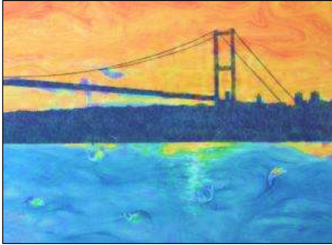
عمل رقم (٣) شكل (١٣)

جسر اليوسفور (ترك برس - Turk press) ، باستخدام تقنيات الإبروارت.