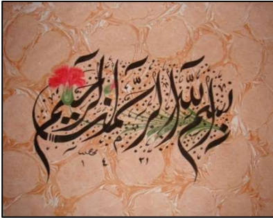
شكل (٦) يجمع بين الابورات وفن الخط العربي في صياغه البسمله .