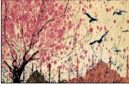
شكل (١٠) يؤرخ احدي معالم المعمار التاريخي التركي المرسومه علي أرضيه وخلفيه تمت معالجتها بتقنيه الابروارت.