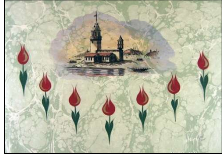
شكل (٩) برج العذراء وهو احدي معالم المعمار التاريخي التركي المرسومه علي أرضيه وخلفيه تمت معالجتها بتقنيه الابروارت.