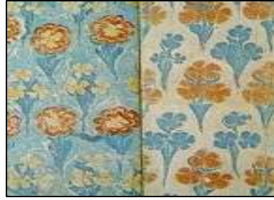
شكل (٣) الورقة الاخيره من كتاب مجلد في تركيا، باستخدام تقنيات الابورات .