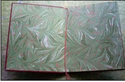
شكل (٤) الورقة الاخيره من كتاب مجلد في تركيا ، باستخدام تقنيا الابورات