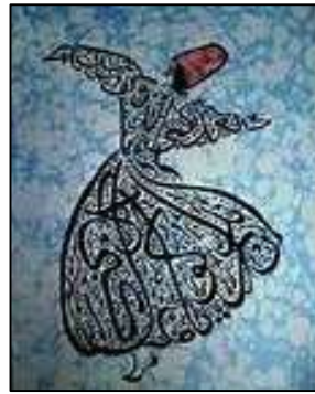
شكل (٥) يجمع بين الابورات وفن الخط العربي ، في صياغه علي هيئه احد ي الرقصات التركيئه الشعبيه .