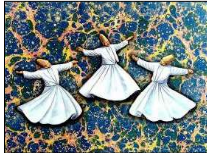
شكل (٧) يورخ الرقص الصوفي التركي علي أرضيه معالجه بتقنيه الابورات.