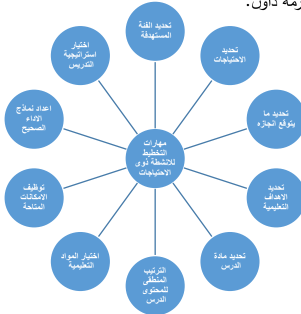
شكل (٣) يوضح مهارات التخطيط لأنشطة لذوي متلازمة داون .