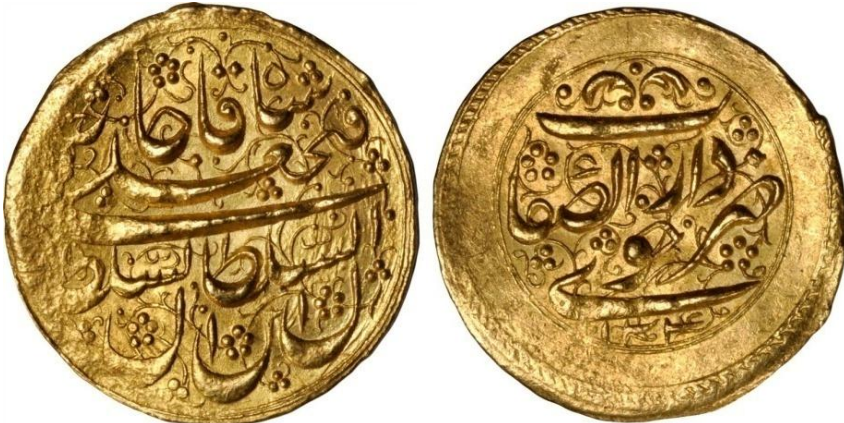
لوحة (١٥) تومان من عهد فتح على شاه قاجار، وزنه ٤,٥٩ جرام، يرجع لسنة ١٢٤٠هـ/١٨٢٤م، عن

http://www.coinarchives.com/w/results.php?search=qajar