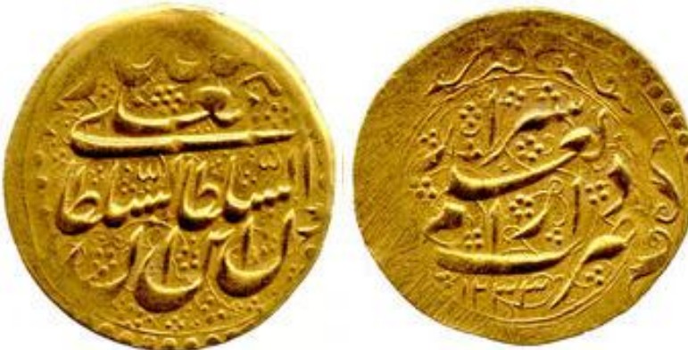
لوحة (٩) تومان من عهد فتح علي شاه قاجار، وزنه ٤,٦١ جرام، ضرب دار العلم شیراز، يرجع لسنة ١٢٣٣هـ / ١٨١٧م، عن

http://www.coinarchives.com/w/results.php?search=qajar