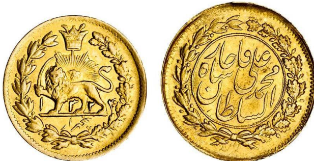
لوحة (٢٩) نصف تومان يساوي ٥٠٠٠ دينار، وزنه ١,٤١ جرام، ضرب طهران ،