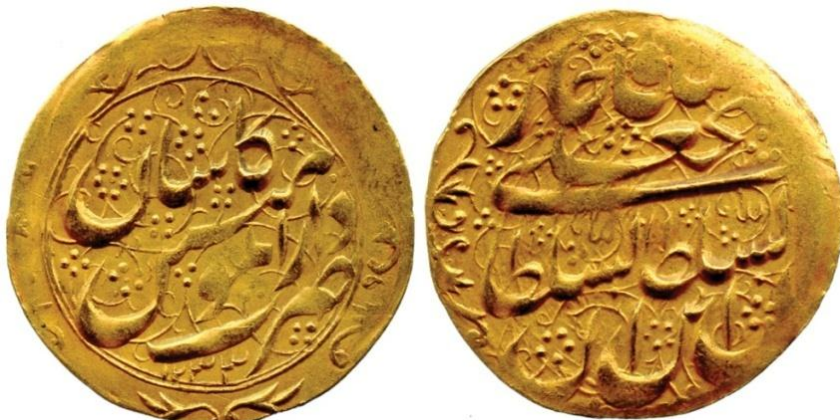
لوحة (١٠) تومان من عهد فتح علي شاه قاجار، ضرب دار المؤمنين قاشان، ويرجع لسنة ١٢٣٣هـ / ١٨١٧م، عن

http://www.coinarchives.com/w/results.php?search=qajar