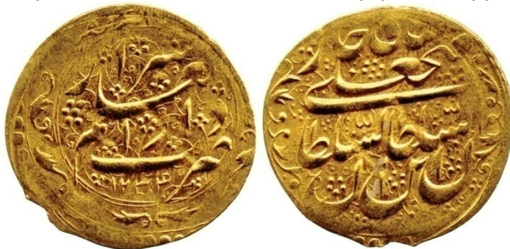
لوحة (١٢) تومان من عهد فتح علي شاه قاجار، وزنه ٤,١٦ جرام، ضرب دار العلم شيراز، ويرجع لسنة ١٢٣٤هـ / ١٨١٨م، عن

http://www.coinarchives.com/w/results.php?search=qajar