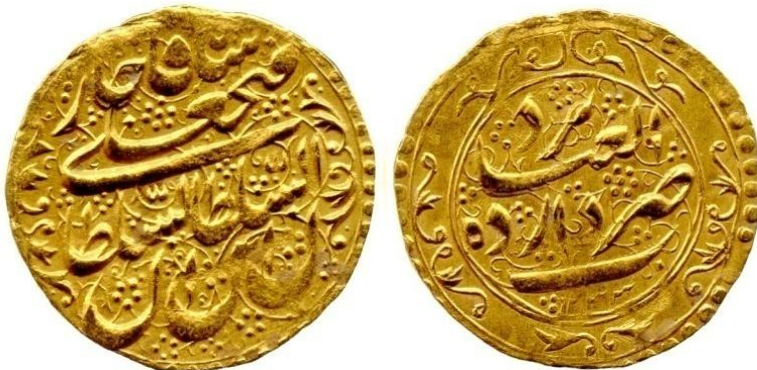
لوحة (١١) تومان من عهد فتح علي شاه قاجار، وزنه ٤,٦٣ جرام، ضرب دار العبادة يزد، ويرجع لسنة ١٢٣٣هـ / ١٨١٧م، عن

http://www.coinarchives.com/w/results.php?search=qajar