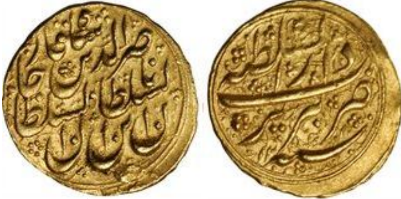
لوحة (١٧) تومان من عهد ناصر الدين شاه قاجار محفوظ بمجموعة الامم المتحدة للنقود الإسلامية، وزنه ٣,٣٨ جرام، ضرب دار السلطنة تبريز، ويرجع لسنة ١٢٧١هـ / ١٨٥٤م، عن http://www.coinarchives.com/w/results.php?search=qajar