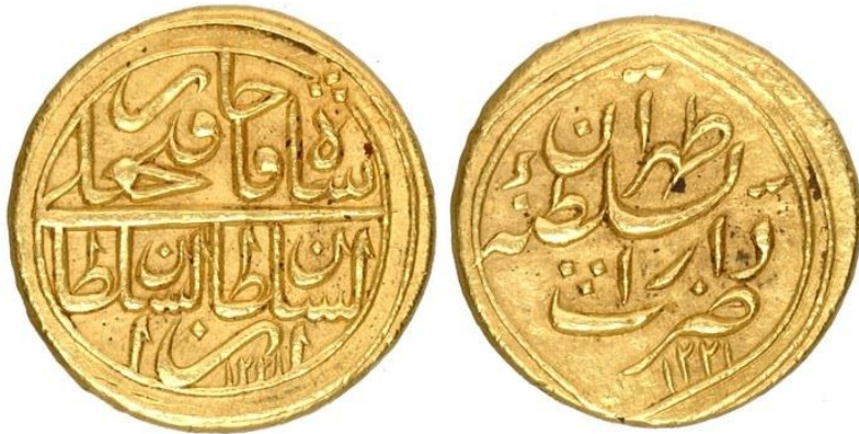
لوحة (٤) تومان من عهد فتح على شاه قاجار، ضرب دار السلطنة طهران ، يرجع لسنة ١٢٢١هـ / ١٨٠٦م، عن

http://numismatics.org/collection/1922.211.883