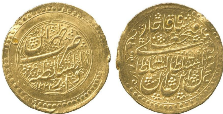
لوحة (٥) تومان ذهبي من عهد فتح على شاه قاجار، وزنه ٥,٥ جرام، ضرب دار السلطنة أصفهان، ويرجع لسنة ١٢٢٢هـ / ١٨٠٧م، عن

http://numismatics.org/collection/1922.211.883