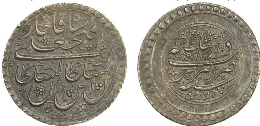
لوحة (٦) ربع ريال من عهد فتح على شاه قاجار، وزنه ٢,٥٥ جرام، ضرب تبريز، ويرجع لسنة ١٢٢٥هـ / ١٨١٠م، عن

http://www.coinarchives.com/w/results.php?search=qajar