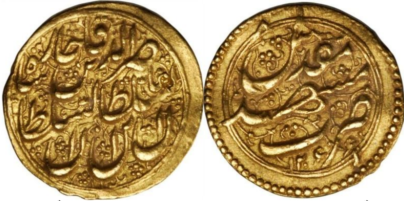
لوحة (١٦) تومان من عهد ناصر الدين شاه قاجار، ضرب مدينة مشهد، ويرجع لسنة ١٢٦٦هـ / ١٨٤٩م، عن http://www.coinarchives.com/w/results.php?search=qajar