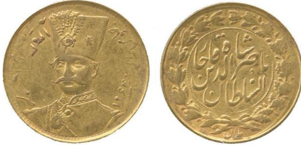
لوحة (٢٧) تومان ذهبي من عهد ناصر الدين شاه قاجار، ضرب طهران، ويرجع لسنة ١٣٠٣هـ / ١٨٨٥م، عن http://www.coinarchives.com/w/results.php?search=qajar