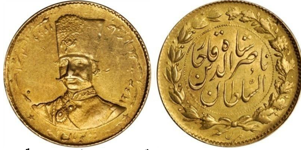
لوحة (٢٦) ٢ تومان من عهد ناصر الدين شاه قاجار محفوظ بمجموعة الامم المتحدة للنقود الإسلامية، ووزنه ٥,٧٥ جرام، ضرب طهران، ويرجع لسنة ١٢٩٩هـ / ١٨٨١م، عن http://www.coinarchives.com/w/results.php?search=qajar