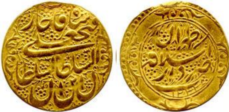
لوحة (٨) تومان من عهد فتح علي شاه قاجار، وزنه ٣,٧٣ جرام، ضرب دار الخلافة طهران سنة ١٢٣٢هـ / ١٨١٦م، عن

http://www.coinarchives.com/w/results.php?search=qajar