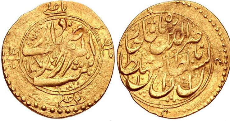
لوحة (١٩) تومان من عهد ناصر الدين شاه قاجار، وزنه ٣,٤٦ جرام، ضرب دار الضرب الميرزا رشت، مؤرخ بسنة ١٢٧٩هـ/١٨٦٢م، عن

http://www.coinarchives.com/w/results.php?search=qajar