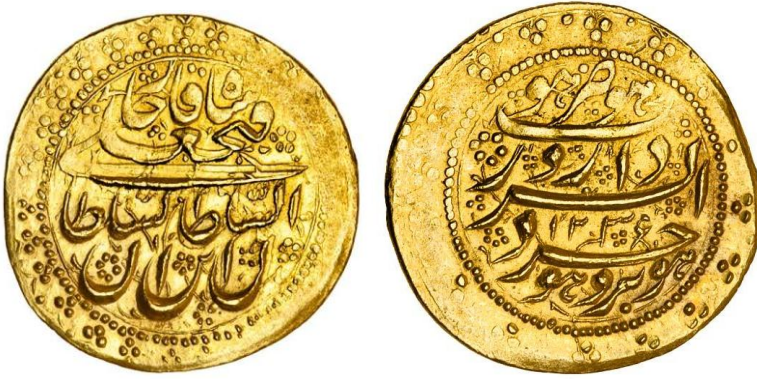
لوحة (١٣) تومان من عهد فتح على شاه قاجار، وزنه ٤,٦٥ جرام ضرب دار السرور بورجرد سنة ١٢٣٦هـ/١٨٢٠م، عن

http://www.coinarchives.com/w/results.php?search=qajar