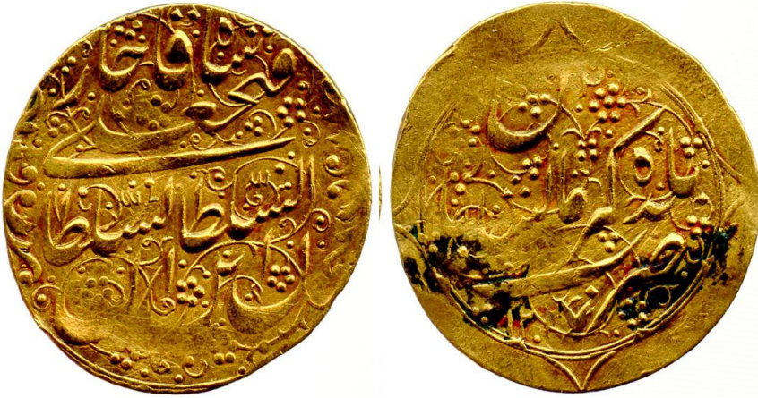
لوحة (٧) تومان من عهد فتح علي شاه قاجار ضرب بلدة کرمانشاه، وزنه ٤,٥٤ جرام يرجع لسنة ١٢٢٧هـ / ١٨١٢م، عن

http://www.coinarchives.com/w/results.php?search=qajar