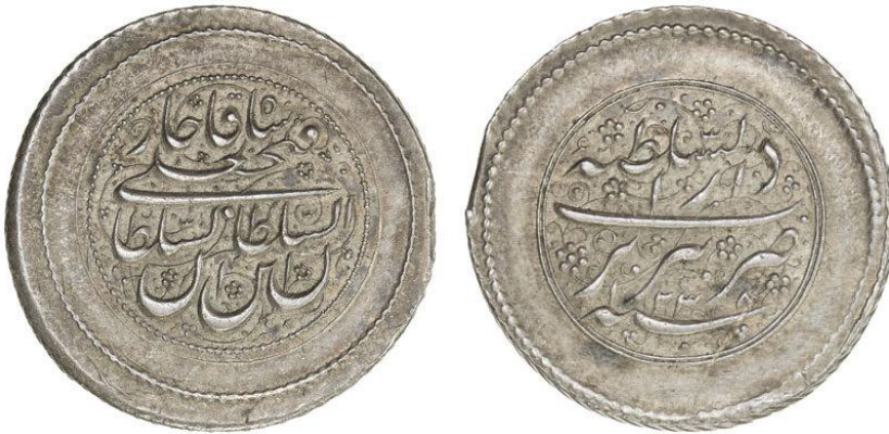
لوحة (١٤) ريال من عهد فتح على شاه قاجار، وزنه ٩,١٩ جرام، ضرب تبريز، ويرجع لسنة ١٢٣٨هـ/١٨٢٢م، عن

http://www.coinarchives.com/w/results.php?search=qajar