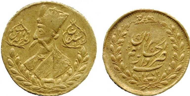
لوحة (١٨) تومان من عهد ناصر الدين شاه قاجار محفوظ بمجموعة الامم المتحدة للنقود الإسلامية، وزنه ٢٧,٢٧ جرام، ضرب دار الخلافة طهران، ويرجع لسنة ١٢٧٢هـ / ١٨٥٤م، عن

http://numismatics.org/collection/1974.26.845