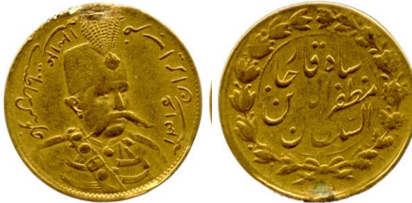
لوحة (٢٨) تومان من عهد مظفر الدين شاه قاجار، وزنه ٢,٨٠ جرام، ضرب إيران، ويرجع تاريخه لسنة ١٣١٦هـ / ١٨٩٨م، عن http://www.coinarchives.com/w/results.php?search=qajar