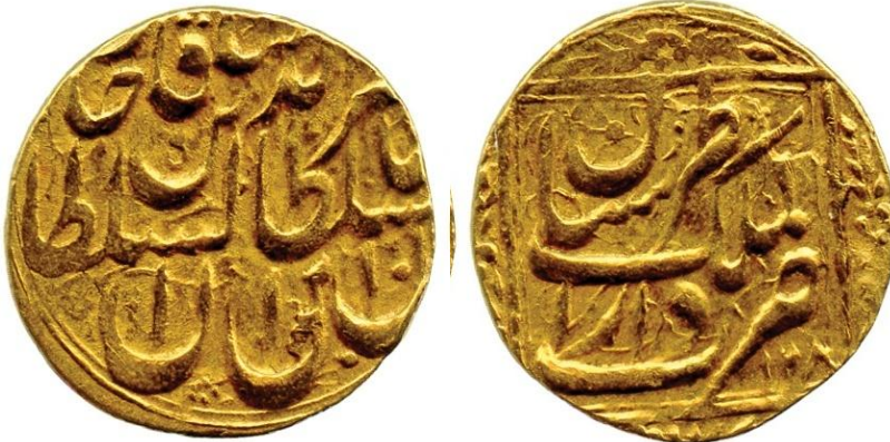
لوحة (٢١) تومان من عهد ناصر الدين شاه قاجار، وزنه ٣,٣٦ جرام، ضرب دار الملك طبرستان، ويرجع لسنة ١٢٨٠هـ/١٨٦٣م، عن

http://www.coinarchives.com/w/results.php?search=qajar