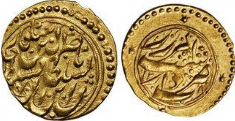
لوحة (٢٠) تومان من عهد ناصر الدين شاه قاجار، وزنه ٣,٤٠ جرام، محفوظ بمجموعة الامم المتحدة للنقود الإسلامية ضرب دار الضرب الميرزا رشت، ويرجع لسنة ١٢٨٠هـ/١٨٦٣م، عن

http://www.coinarchives.com/w/results.php?search=qajar