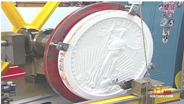
ماكينة البانتوجراف تقوم بالتكبير اوالتصغير للشكل النحتي وحفر نموذج يحاكي الاصل علي الصلب