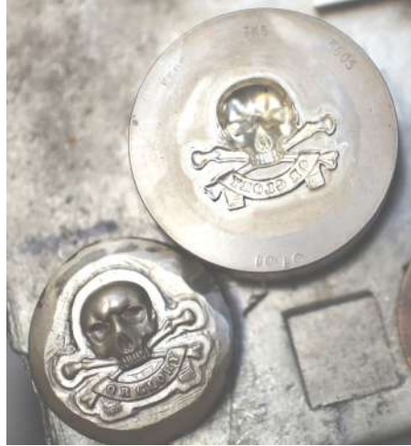
قالب من الصلب تم حفره بماكينة البانتوجراف Pantograph