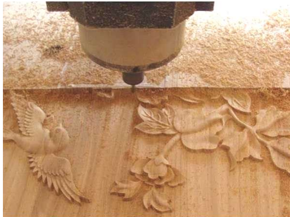
ماكينة حفر راوتر متصلة بالحاسوب