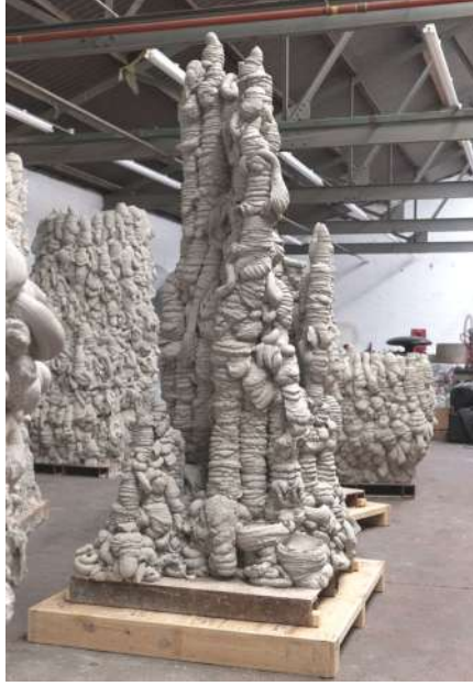
عمل للفنان انيش كابور Anish Kapoor

فمازال النقاش الجدلي حول عملية خلق العمل الفني عبر التاريخ هل هو يدويا ام عقليا هذا الاختلاف قائم بين الحرفيين والفنانين حتى يومنا هذا.