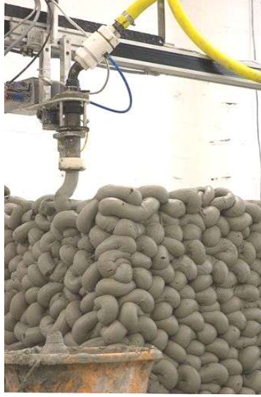
طباعة ثلاثية الابعاد باستخدام خامة الطين

تجربة انيش كابور الفنية و هو نحات بريطاني ولد في بومباي ١٢ مارس ١٩٥٤ ، عاش كابور وعمل في لندن منذ اوائل السبعينات، عندما انتقل الى دراسة الفن في كلية هورنزي للفنون، وبعد ذلك في كلية تشيلسي للفنون والتصميم.