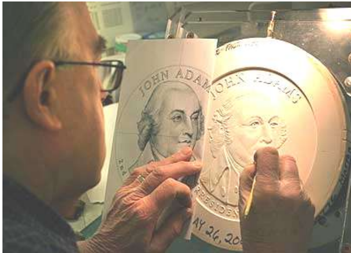
نحت نموذج الميدالية

وبعد انتهاء عمل الالة يصبح عندنا قالب من الصلب، يمكن النسخ من خلاله اعداد كبيرة لشكل الميدالية والعملة بالحجم الذي نريده، و هي من التقنيات القديمة في صناعة العملة .